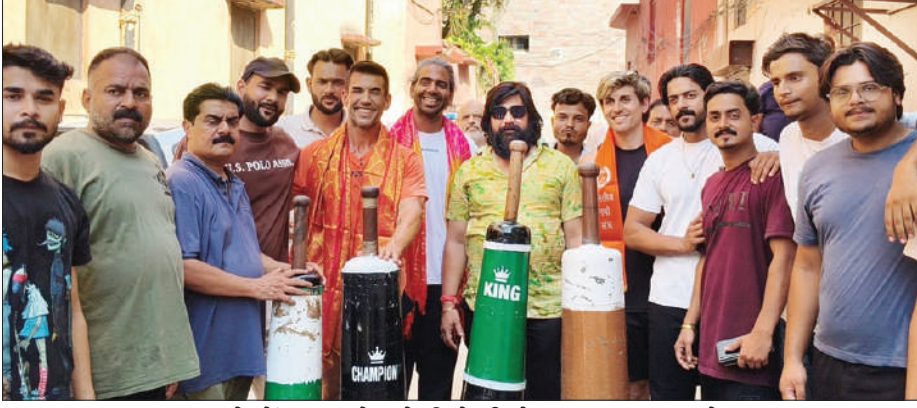
अखाड़े में बल्लम देखते विदेशी मेहमान व अन्य लोग।