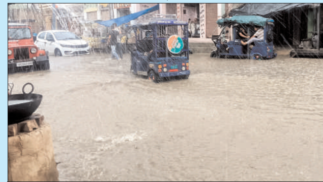
नांगल के मुख्य बाजार में जल भराव का दृश्य।