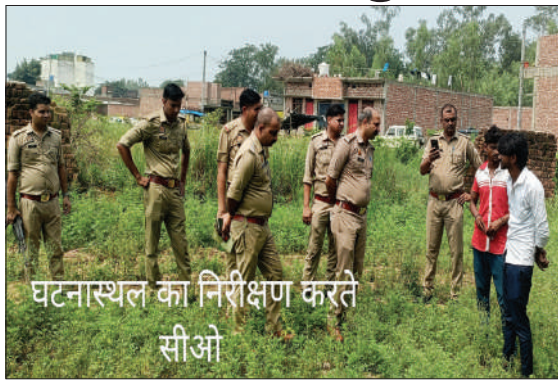
घटनास्थल का निरीक्षण करते सीओ