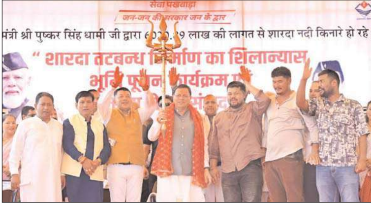
मुख्यमंत्री श्री पुष्कर सिंह धामी जी द्वारा 60.21.9 लाख की लागत से शारदा नदी किनारे हो रहे

मुख्यमंत्री ने 60.21 करोड़ की लागत से बूम से टनकपुर तक शारदा नदी के तट पर बाढ़ सुरक्षा तटबंध निर्माण कार्य तथा 5.74 करोड़ की लागत से पूर्णागिरी तहसील के ग्राम छीनीगोट की सुरक्षा के लिए हुड्डी नदी पर बाढ़ सुरक्षा दीवार निर्माण परियोजना का शिलान्यास किया। कार्यक्रम में मुख्यमंत्री का पारंपरिक कुमाऊंजी रीति-रिवाजों के साथ स्वागत किया गया। स्थानीय स्वयं सहायता समूहों की महिलाओं और क्षेत्रवासियों ने टीका, पटका, कुमाऊंजी टोपी, पुष्पवर्षा और छोलिया नृत्य के माध्यम से उनका अभिनंदन किया। शिलान्यास कार्यक्रम से पहले मुख्यमंत्री ने शारदा नदी पर चल रहे