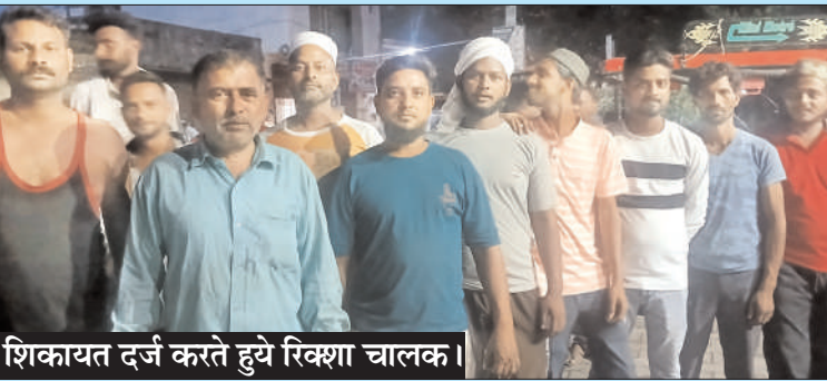
शिकायत दर्ज करते हुये रिक्शा चालक।