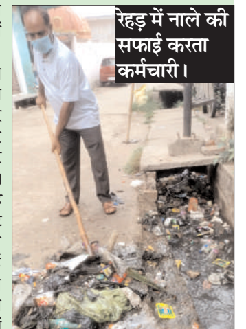
रेहड़ में नाले की सफाई करता कर्मचारी।