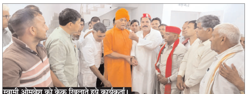
स्वामी ओमवेश को केक खिलाते हुये कार्यकर्ता।

चांदपुर ( चिंगारी )। समाजवादी पार्टी कार्यकर्ताओं ने स्थानीय डाक बंगले में पार्टी के राष्ट्रीय अध्यक्ष एवं पूर्व मुख्यमंत्री अखिलेश यादव का जन्मदिन धूमधाम के साथ मनाया। इस अवसर पर केक काटा गया तथा एक-दूसरे का मुंह मीठा कराकर पूर्व मुख्यमंत्री अखिलेश यादव की दीर्घायु की कामना की गई। इस अवसर पर कार्यकर्ताओं ने अगले वर्ष होने वाले विधानसभा चुनाव में पूर्व मुख्यमंत्री अखिलेश यादव को पुनः मुख्यमंत्री बनाने का संकल्प लिया गया। इस अवसर पर विधायक स्वामी