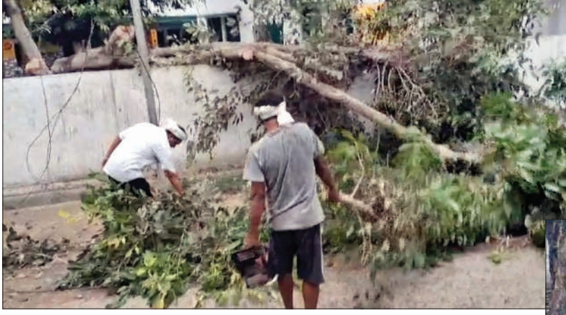
कटे पेड़ की टहनी हटाते दो व्यक्ति

स्योहारा (चिंगारी)। ग्राम मंडोरी के सरकारी स्कूल में कई वर्षों से खड़ा पिलखन का पेड़ छटाई करने के नाम पर काट दिया गया, जिसमें दर्जनों पक्षियों की मौत हो गयी। पास ही लाइट का खंभा भी टूट गया।