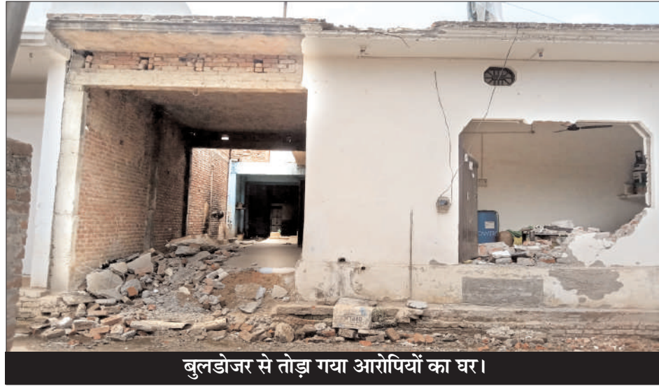
बुलडोजर से तोड़ा गया आरोपियों का घर।