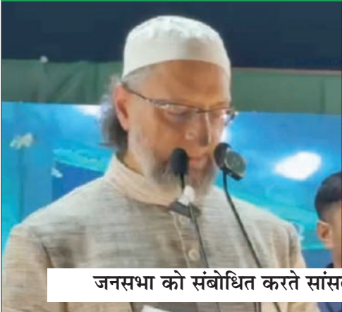
जनसभा को संबोधित करते सांसद ओवैसी व मोबाइल की लाइट जलाकर ओवैसी का समर्थन करते कार्यकर्ता।