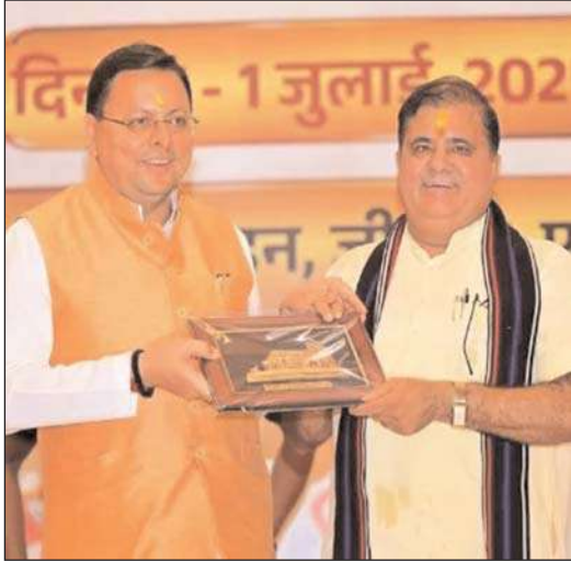
उन्होंने कहा कि भाजपा की राजनीति केवल चुनाव जीतने तक सीमित नहीं, बल्कि

भाजपा नेतृत्व का मानना है कि पार्टी की सबसे बड़ी ताकत उसके समर्पित कार्यकर्ता हैं, जिन्होंने हर चुनाव में बूथ स्तर पर संगठन को मजबूत किया है। मुख्यमंत्री धामी ने कार्यकर्ताओं से जनता के बीच जाकर सरकार की उपलब्धियों, विकास कार्यों और जनकल्याणकारी योजनाओं की जानकारी देने के साथ-साथ लोगों की समस्याएं सुनने और उनका फीडबैक लेने का आग्रह किया।