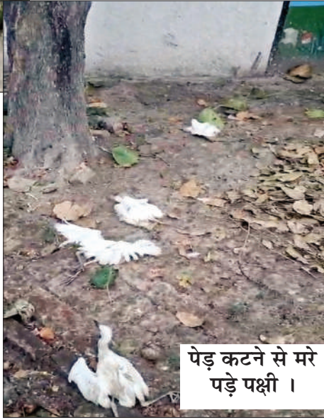
पेड़ कटने से मरे पड़े पक्षी।