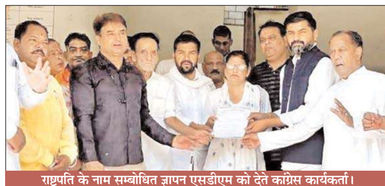
राष्ट्रपति के नाम सम्बोधित ज्ञापन एसडीएम को देते कांग्रेस कार्यकर्ता।

ऋषिकेश (चिंगारी)। महानगर कांग्रेस कमेटी ने नीट पेपर लीक मुद्दे पर सरकार की हीला, हवाली और जिम्मेदारी से बचने को देखते हुए शिक्षा मंत्री की बर्खास्तगी और दोषियों पर कड़ी से कड़ी कार्यवाही की मांग को लेकर राष्ट्रपति को एक ज्ञापन प्रेषित किया।