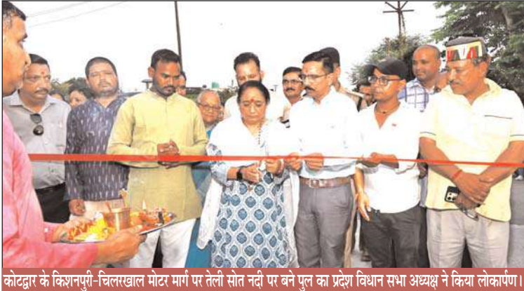
कोटद्वार के किशनपुरी-चिलरखाल मोटर मार्ग पर तेली स्रोत नदी पर बने पुल का प्रदेश विधान सभा अध्यक्ष ने किया लोकार्पण।

इस अवसर पर उन्होंने कहा कि प्रदेश सरकार के नेतृत्व में कोटद्वार विधानसभा में आधारभूत संरचनाओं को सुदृढ़ करने के लिए निरंतर कार्य किए जा रहे हैं। यह पुल किशनपुर, त्रिलोकपुर, लोकमणिपुर, रामदयालपुर, हलदुखाता, मनदेवपुर,