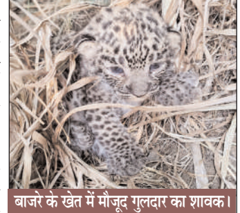
बाजरे के खेत में मौजूद गुलदार का शावक।