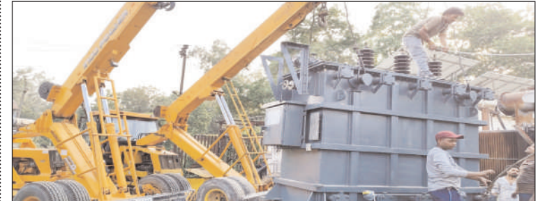
बिजली घर पर नया ट्रांसफार्मर लगाते हुए विद्युतकर्मियों।

धामपुर (चिंगारी)। उप जिलाधिकारी कार्यालय के पास स्थित 33/11 उप केंद्र पर आखिरकार विद्युत वितरण खंड धामपुर के स्टाफ ने रामपुर से नया ट्रांसफार्मर मंगाकर स्थापित कर दिया है, जिससे 48 घंटे बाद आज प्रातः 5 बजे से नगरवासियों को विद्युत आपूर्ति मिल पाई और उन्होंने भीषण गर्मी में भारी राहत महसूस की। उल्लेखनीय है कि शुक्रवार की शाम 5 बजे 33/11 केवीए सब स्टेशन पर रखा 10 एम वीए क ट्रांसफार्मर में तकनीकी खराबी आ गई थी जिसको ठीक करने का प्रयास विभाग के कर्मचारियों द्वारा लगातार किया जा रहा था परंतु उसके ठीक ना हो पाने पर शनिवार को रामपुर से नया ट्रांसफार्मर मंगा कर उसे कल शाम लगाकर काम शुरू कर दिया गया था, परंतु पूरी रात बिजली नहीं आने पर आम जनजीवन बुरी तरह प्रभावित रहा। मार्केट में कल शाम व्यापारियों ने अपने प्रतिष्ठान जल्दी बंद कर दिए, घरों के फ्रिज में रखा हुआ दूध और अन्य खाद्य पदार्थ खराब हो गया और बच्चों महिलाओं और बुजुर्गों को भीषण गर्मी में पूरी रात करवट बदल कर गुजारनी पड़ी। विद्युत विभाग की कड़ी मशकत के बाद बीती रात ट्रांसफार्मर के कनेक्शन होने के बाद आज प्रातः 5 बजे विद्युत आपूर्ति शुरू की जा सकी।