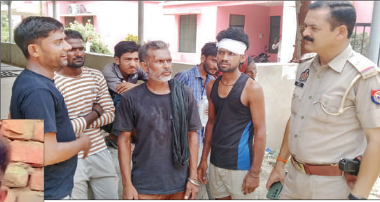
पोस्टमार्टम हाउस पर ग्रामीण से पूछताछ करते थाना प्रभारी

पुरानी रंजिश बनी खूनी वारदात की वजह, मजदूरी को लेकर चल रहा था विवाद; परिवार में मचा कोहराम, गांव में पसरा मातम