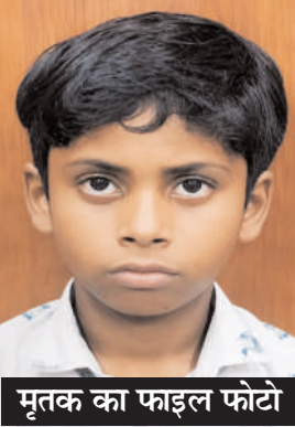
मृतक का फाइल फोटो

अचानक नलकूप के बने झरे में गिर गया। जिसे मौके पर मौजूद लोगों ने किसी तरह बाहर निकाला और उपचार के लिए जिला अस्पताल ले जाया गया, जहां उसकी मौत हो गई। मौत का कारण झरे में बनी