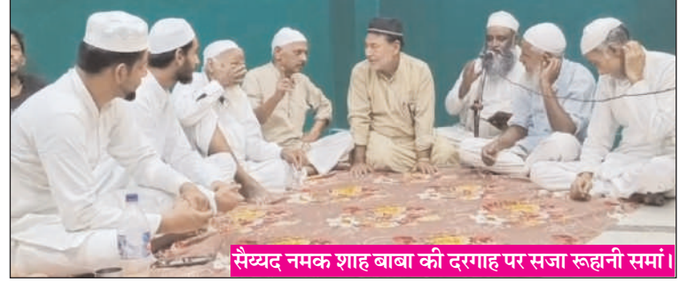
सैयद नमक शाह बाबा की दरगाह पर सजा रूहानी समां।

भाजपा के लिए सबसे बड़ी चुनौती सत्ता विरोधी माहौल को नियंत्रित करना होगा। लगातार दो कार्यकाल सरकार चलाने के बाद स्वाभाविक रूप से जनता की अपेक्षाएं भी बढ़ी हैं। बेरोजगारी, पलायन, सड़क, स्वास्थ्य, शिक्षा और स्थानीय विकास जैसे मुद्दों पर विपक्ष सरकार को घेरने की तैयारी में है। ऐसे में कोर कमेटियां केवल चुनावी मशीनरी नहीं बल्कि सरकार और जनता के बीच संवाद का माध्यम भी बनेंगी।