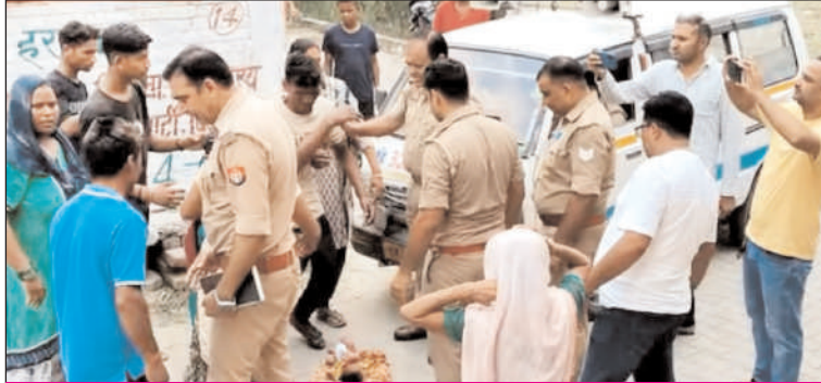
साईं हॉस्पिटल के बाहर मौजूद पुलिस बल।