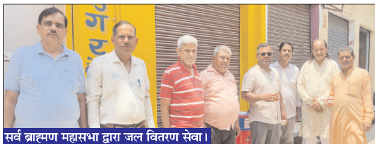
सर्व ब्राह्मण महासभा द्वारा जल वितरण सेवा।