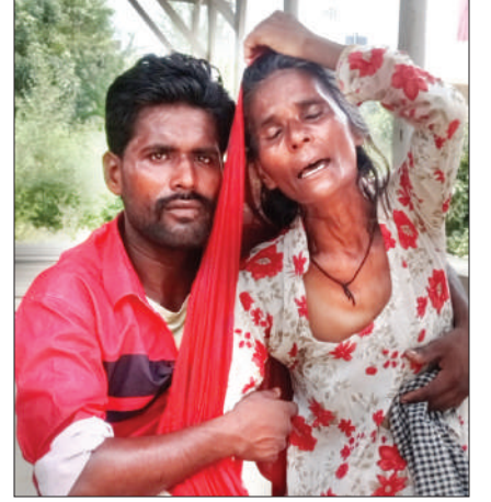
बिजनौर पोस्टमार्टम हाउस पर विलाप करते मृतक के परिजन