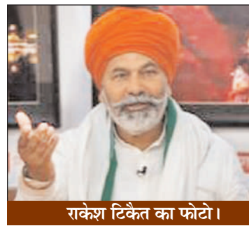
राकेश टिकैत का फोटो।