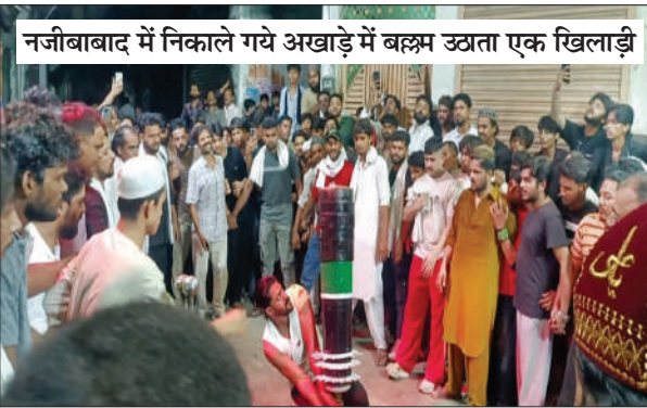
नजीबाबाद में निकाले गये अखाड़े में बल्लम उठाता एक खिलाड़ी