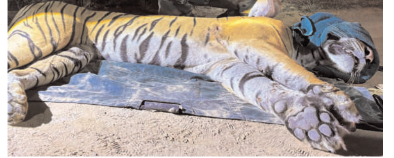
रेस्क्यू सेंटर में मौजूद घायल बाघ।

जानकारी के अनुसार बाघ के अगले दोनों पैरों में गंभीर चोट लगी है। और उसका दाहिना पैर का पंजा अधिक प्रभावित है। वन विभाग की प्रारंभिक जानकारी के अनुसार यह चोट किसी अन्य बाघ के साथ हुए संघर्ष के दौरान लगने की संभावना है। शुक्रवार को वन विभाग की टीम ने पूरी सतर्कता के साथ रेस्क्यू अभियान चलाया। विशेषज्ञों द्वारा बाघ का स्वास्थ्य परीक्षण किया जा रहा है और उसकी