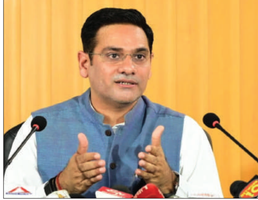
प्रदान की। उन्होंने कहा कि दुबई में आयोजित गल्फ फूड एक्सपो के दौरान

सहकारी समितियों ने ये मछलियां तैयार की थीं। कोल्ड-चेन बनाए रखते हुए मछली को गुजरात के वेरावल भेजा गया, जहां प्रसंस्करण के बाद 23 जून 2026 को नेपाल के अंतरराष्ट्रीय बाजार में इसका सफलतापूर्वक निर्यात किया गया। इससे 33 मत्स्य पालकों को लगभग 23.50 लाख की आय प्राप्त हुई है। कैबिनेट मंत्री के अनुसार-उत्तराखंड के इस पहले निर्यात को प्रोत्साहित करने हेतु मत्स्य विभाग ने हार्वेस्टिंग, पैकेजिंग एवं परिवहन के लिए 5.40 लाख की गैप फंडिंग सहायता