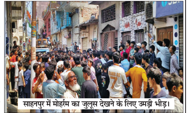
साहनपुर में मोहर्रम का जुलूस देखने के लिए उमड़ी भीड़।