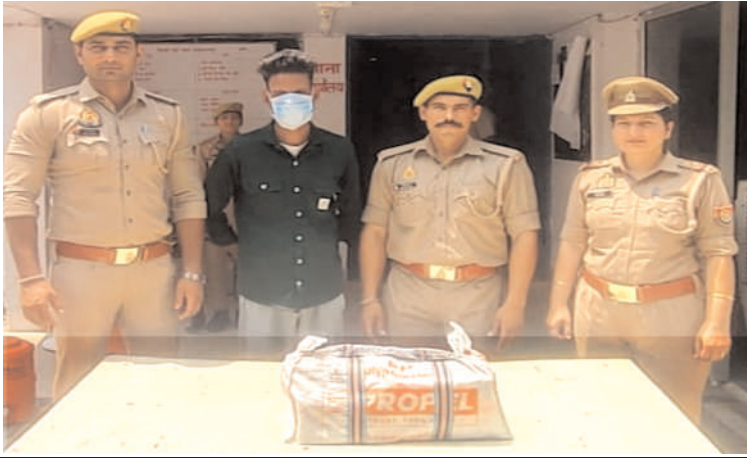
पुलिस हिरासत में आरोपी।

अफजलगढ़ (चिंगारी)। नगर के रामलीला बाजार स्थित एक इलेक्ट्रिशियन की दुकान में करीब 13 दिन पूर्व हुई चोरी की घटना के मामले में पुलिस ने कार्रवाई करते हुए एक व्यक्ति को चोरी के सामान