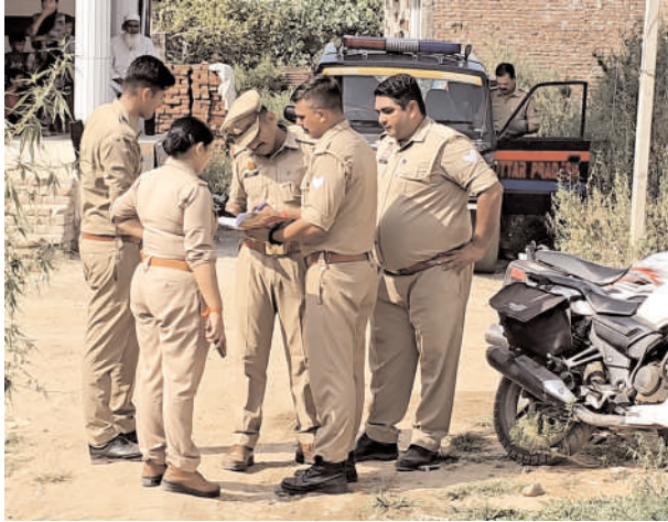
मृतक के घर मौजूद पुलिस फोर्स।