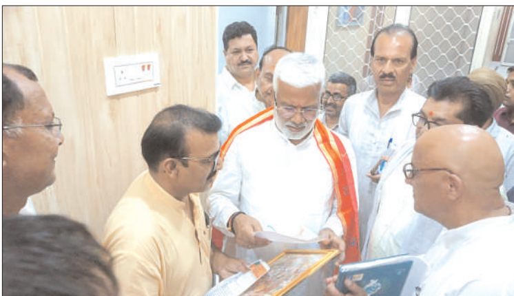
कालागढ़ में मध्य गंगा फेज-2 परियोजना की समीक्षा करते जल शक्ति एवं संसाधन मंत्री स्वतंत्र देव सिंह।

रामगंगा भवन में आयोजित समीक्षा में मंत्री स्वतंत्र देव सिंह ने कहा कि मध्य गंगा फेज-2 परियोजना किसानों के लिए बेहद महत्वपूर्ण है। परियोजना पूर्ण होने के बाद बिजनौर, मुरादाबाद, अमरौहा और संभल जनपदों के किसानों को सिंचाई के लिए पर्याप्त जल उपलब्ध होगा, जिससे कृषि उत्पादन बढ़ेगा और किसानों के खेत हरियाली से भर जायेंगे। उन्होंने बताया कि मध्य गंगा फेज-2 परियोजना का कार्य लगभग पूरा हो चुका है। जल्द ही इस महत्वाकांक्षी परियोजना का लोकार्पण किया जाएगा। इसके साथ ही उन्होंने पूर्वी गंगा क्षेत्र के अंतर्गत आने वाली नहरों की सिंचाई व्यवस्था की भी समीक्षा की और अधिकारियों को सभी कार्यों को निर्धारित समय सीमा में पूरा करने के निर्देश दिये।