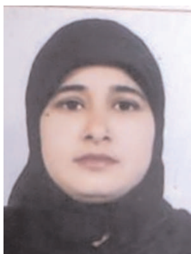
महिला का फाइल फोटो