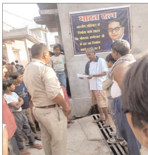
विवाद होने के बाद जानकारी करती पुलिस

खाईखेड़ा के कुछ ग्रामीणों एवं ग्राम प्रधान के द्वारा दो-तीन माह पूर्व जिलाधिकारी एवं उपजिलाधिकारी को दिए गये प्रार्थना-पत्र में कहा गया था कि खसरा नम्ब 55 श्रेणी 6-2 रकवा 0.1880 पर पूर्व ग्राम प्रधान द्वारा डाक्टर भीमराव अम्बेडकर धर्मशाला के नाम पर जमीन को संरक्षित कर छोड़ा गया था। लेकिन गांव के रविदास पंथियों द्वारा संत रविदास की मूर्ति रखकर अवैध