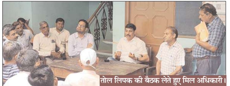
तौल लिपक की बैठक लेते हुए मिल अधिकारी।