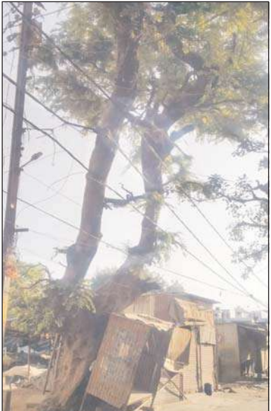
बिजली के तारों पर झुका हुआ इमली का पेड़।