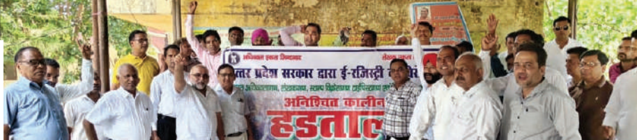
एसडीएम कार्यालय में ज्ञापन देने जाते रेवेन्यू बार एसोसिएशन के अधिवक्ता।