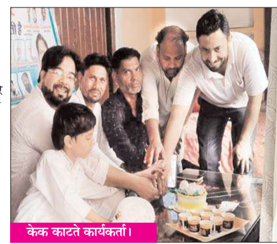
केक काटते कार्यकर्ता।