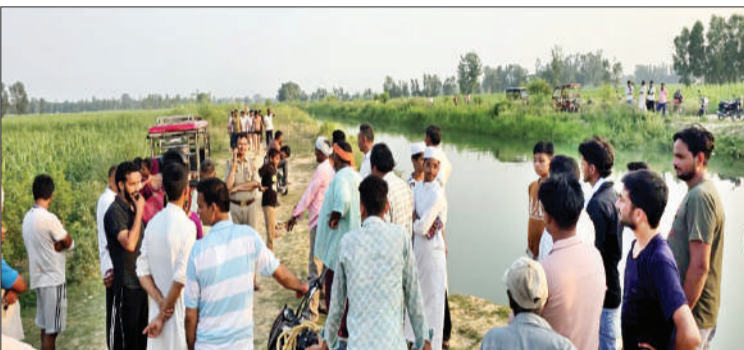
नहर के पास पुलिस प्रशासन व ग्रामीण

स्योहारा (चिंगारी)। पत्नी और बच्चे को अपनी ससुराल छोड़कर वापस आने वाले व्यक्ति की नहर में डूबने से मौत हो गयी। घंटों की तलाश के बाद पुलिस ने नहर से युवक को निकाला और सरकारी अस्पताल भेजा जहां चिकित्स ने उसे मृत घोषित कर दिया। पुलिस ने पंचनामा भर पोस्टमार्टम के लिए भेज दिया।