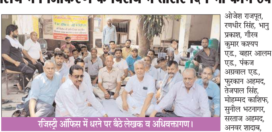
रजिस्ट्री ऑफिस में धरने पर बैठे लेखक व अधिवक्तागण।

नजीबाबाद (चिंगारी)। उप निबन्धक कार्यालय में फ्रंट ऑफिस खोलने तथा रजिस्ट्री के निजीकरण किये जाने के विरोध में उप निबन्धक कार्यालय नजीबाबाद के दस्तावेज लेखकगण, अधिवक्ता गण तथा स्टायम विक्रेतागण ने सरकार के फैसले के विरोध में कार्य बहिष्कार कर अनिश्चितकालीन धरना तीसरे दिन भी जारी रखा। शुक्रवार को रजिस्ट्री ऑफिस नजीबाबाद के सभी दस्तावेज लेखकगण, अधिवक्ताओं तथा स्टायम विक्रेताओं ने पूर्ण रूप से कार्य का बहिष्कार किया तथा अनिश्चितकालीन धरने पर बैठे रहे, जिसके चलते निबन्धन विभाग के उप निबन्धक कार्यालय में एक भी रजिस्ट्री नहीं हुई जिससे सरकार को लाखों