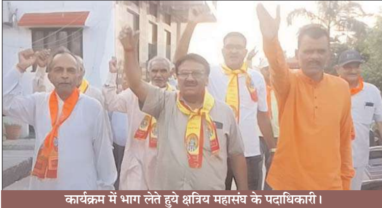
कार्यक्रम में भाग लेते हुये क्षत्रिय महासंघ के पदाधिकारी।