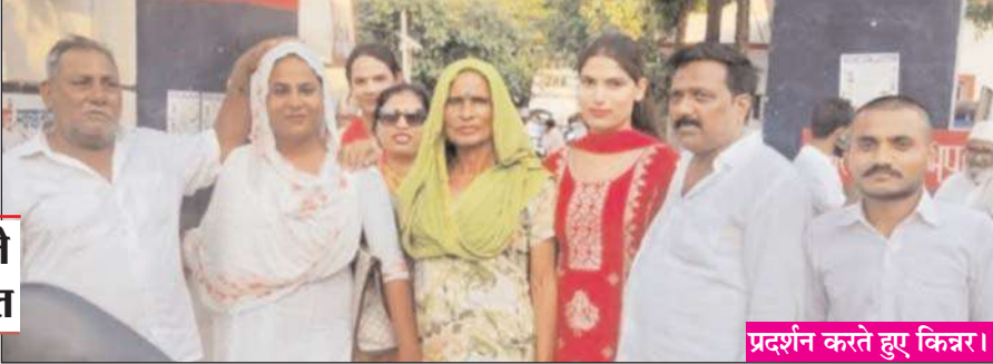
प्रदर्शन करते हुए किन्नर।

किन्नर बनकर अवैध वसूली करने का आरोप लगाया है। शिकायत पत्र के अनुसार, कुछ लोग किन्नरों का वेश धारण कर ट्रेनों, बसों तथा चौराहों पर लोगों से अवैध रूप से धन वसूल रहे हैं। आरोप है कि ये लोग रात के समय भी वसूली करते हैं और आम जनता के साथ अभद्र व्यवहार करते हैं। शिकायतकर्ताओं का कहना है कि उक्त व्यक्ति वास्तविक किन्नर समाज से संबंधित नहीं हैं, बल्कि फर्जी तरीके से किन्नर बनकर हमारी छवि को धूमिल कर रहे हैं। पत्र में यह भी उल्लेख किया गया है कि कुछ नामित व्यक्ति धामपुर क्षेत्र में किराए