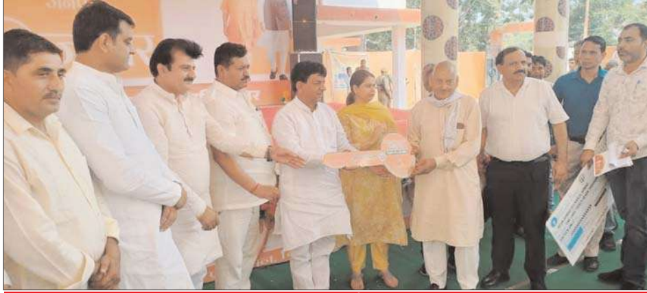
कार्यशाला में एक लाभार्थी को चाबी सौंपते हुए प्रभारी मंत्री कपिल देव।