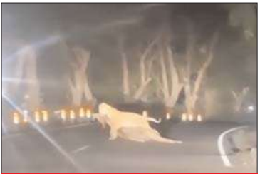
सांभर का शिकार कर ले जाता बाघ।

अफजलगढ़ ( चिंगारी )। क्षेत्र में उस समय कार सवार लोगों की सांसें थम गईं, जब उन्होंने सड़क पर एक बाघ को सांभर का शिकार मुंह में दबाकर कार के सामने से ले जाते देखा। अचानक सामने आए बाघ को देखकर कार में सवार लोग सहम गये।