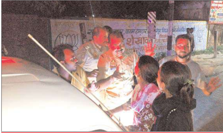
एम्बुलेंस को रोकते परिजनों को समझाती पुलिस