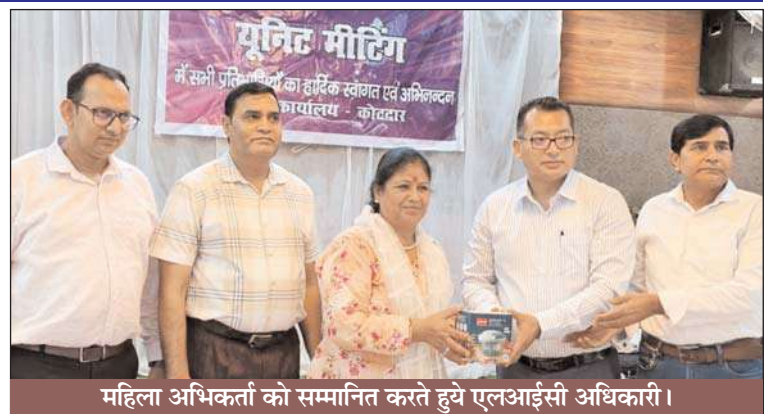
महिला अभिकर्ता को सम्मानित करते हुये एलआईसी अधिकारी।