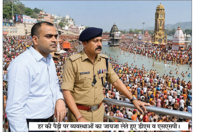
हर की पैड़ी पर व्यवस्थाओं का जायजा लेते हुए डीएम व एसएसपी।

पहले ही अनुमान लगाया जा रहा था कि एक करोड़ से अधिक श्रद्धालु गंगा स्नान के लिए हरिद्वार पहुंचेंगे। शनिवार, रविवार और सोमवार तीन दिन लगातार