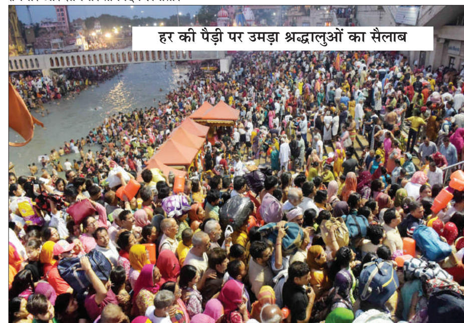
हर की पैड़ी पर उमड़ा श्रद्धालुओं का सैलाब

श्रद्धालु हरिद्वार पहुंचते रहे। हाईवे पर भले ही जाम की स्थिति रही हो, लेकिन शहर के