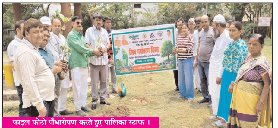
फाइल फोटो पौधारोपण करते हुए पालिका स्टाफ।

धामपुर (चिंगारी)। 5 जून विश्व पर्यावरण दिवस पर नगर पालिका परिषद धामपुर द्वारा शिवाजी पार्क के एक परिसर में किया गया पौधारोपण मात्र खाना पूर्ति होकर रह गया है। मात्र एक सप्ताह के भीतर पालिका स्टाफ द्वारा लगाए गए पौधों की पत्तियां झड़ गई हैं और टहनियां सूखने लगी हैं, जिससे ऐसा प्रतीत होता है कि नगर पालिका स्टाफ ने यहाँ पौधे लगाकर मात्र सरकारी आदेश का ही पालन किया है। नगर पालिका परिषद, धामपुर के शिवाजी पार्क में चार परिसर बने हुए हैं जिनमें एक परिसर में संपाकाचार्य पंडित रुद्रदत्त शर्मा पुस्तकालय और नए पौधों की क्यारियां बनी हुई हैं, जबकि दूसरे परिसर में पालिका द्वारा विशेष रूप से सजाए गए फूलों वाले पौधे लगाए गए हैं, तीसरी परिसर में