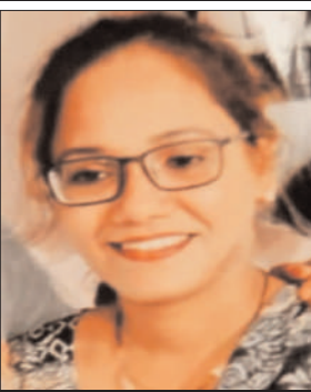
मृतका का फाइल फोटो