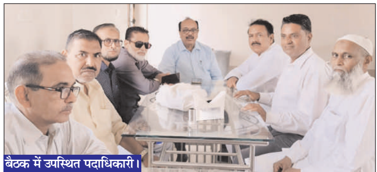
बैठक में उपस्थित पदाधिकारी।

धामपुर (चिंगारी)। आल इंडिया मोमिन कॉन्फ्रेंस के राष्ट्रीय अध्यक्ष फिरोज अहमद अंसारी ने कहा कि किसी भी समाज की असली तरक्की शिक्षा, जागरूकता और आपसी भाईचारे से ही संभव है। उन्होंने युवाओं से शिक्षा को प्राथमिकता देने और समाज हित में आगे आने का आह्वान भी किया। आल इंडिया मोमिन कॉन्फ्रेंस के राष्ट्रीय अध्यक्ष फिरोज अहमद अंसारी ने एक रिजोर्ट में आयोजित प्रेस वार्ता के दौरान कहा कि समाज की तरक्की के लिए शिक्षा, आपसी भाईचारा और युवाओं को जागरूक करना बेहद जरूरी है। उन्होंने कहा कि संगठन लगातार समाज के कमजोर वर्गों के उत्थान एवं अधिकारों की आवाज को बुलंद करने का कार्य कर रहा है। उन्होंने