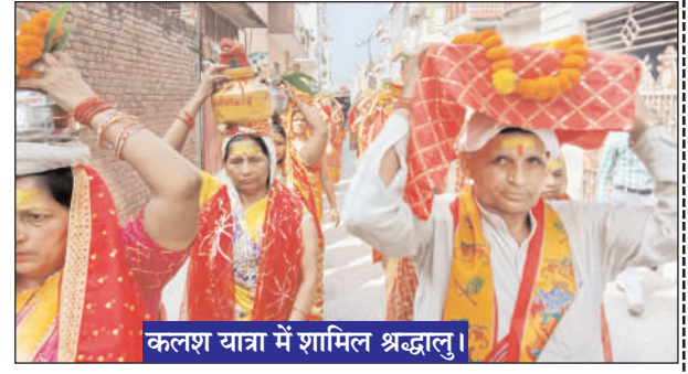
कलश यात्रा में शामिल श्रद्धालु।

धामपुर (चिंगारी)। रानी बाग कॉलोनी में प्रारंभ हुए सात दिवसीय श्रीमद् भागवत कथा ज्ञान यज्ञ महोत्सव के पहले दिन कलश यात्रा