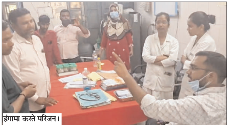
हंगामा करते परिजन।

बिजनौर (चिंगारी)। जिला अस्पताल के मेडिकल वार्ड में भर्ती एक मरीज के उपचार में लापरवाही और बाहर से दवा लिखे जाने के आरोप को लेकर बुधवार को मरीज के परिजनों ने अस्पताल में हंगामा कर दिया। परिजनों ने चिकित्सकों पर सही उपचार न देने तथा सरकारी अस्पताल में उपलब्ध सुविधाओं का लाभ न मिलने का आरोप लगाया।