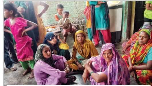
मासूम की मौत पर विलाप करती मां व अन्य महिलायें