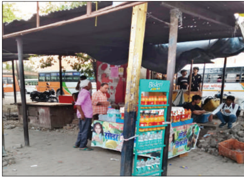
रोडवेज में टीनशैड के पास हुआ अतिक्रमण।