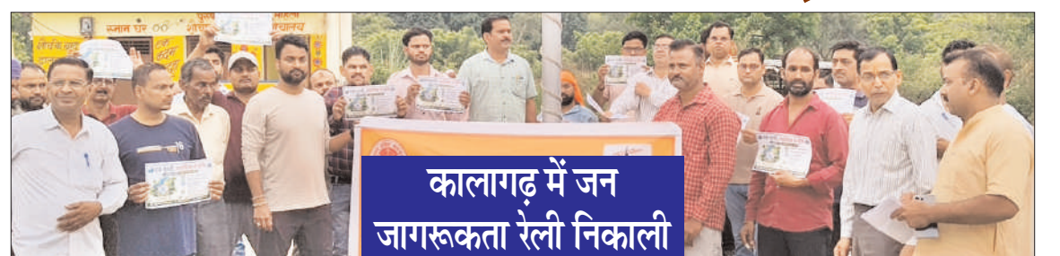
कालागढ़ में जन जागरूकता रैली निकाली

अफजलगढ़ ( चिंगारी )। उत्तर प्रदेश सरकार के समेकित जन कल्याण एवं जन जागरूकता अभियान के तहत रामगंगा बांध खंड कालागढ़ द्वारा पर्यावरण संरक्षण एवं स्वच्छता को बढ़ावा देने के उद्देश्य से विभिन्न कार्यक्रम आयोजित किए गए। जानकारी के अनुसार अभियान के अंतर्गत अफजलगढ़ बैराज के डाउन स्ट्रीम क्षेत्र में रामगंगा नदी के दाएं तट पर फैली प्लास्टिक पत्रियों एवं अन्य अपशिष्ट पदार्थों को हटाकर विशेष स्वच्छता अभियान चलाया गया। अधिकारियों और कर्मचारियों ने श्रमदान कर नदी तट की सफाई की तथा स्वच्छ पर्यावरण का संदेश दिया। इसके पश्चात पुराना कालागढ़