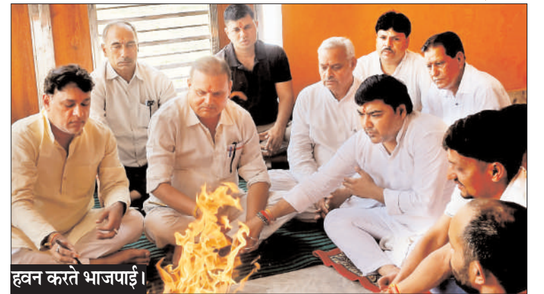
हवन करते भाजपाई।