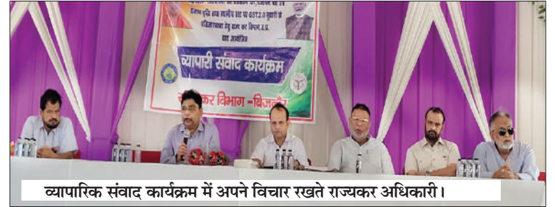
व्यापारिक संवाद कार्यक्रम में अपने विचार रखते राज्यकर अधिकारी।

व्यापारी दुर्घटना बीमा व अन्य सरकारी योजनाओं की जानकारी दी। उन्होंने बताया कि प्रदेश में व्यापारिक गतिविधियों के प्रोत्साहन, पंजीयन बेस व राजस्व वृद्धि तथा स्थानीय स्तर पर जीएसटी 2.0 सुधारों के प्रति जागरूकता फैलाने के उद्देश्य से खंड स्तर पर व्यापारी संवाद कार्यक्रम आयोजित किए जा रहे हैं। व्यापारियों ने अपनी कई समस्याओं को