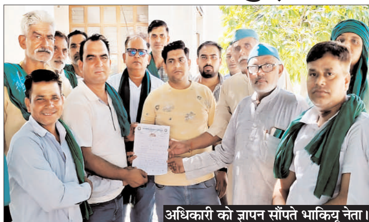
अधिकारी को ज्ञापन सौंपते भाकियू नेता।