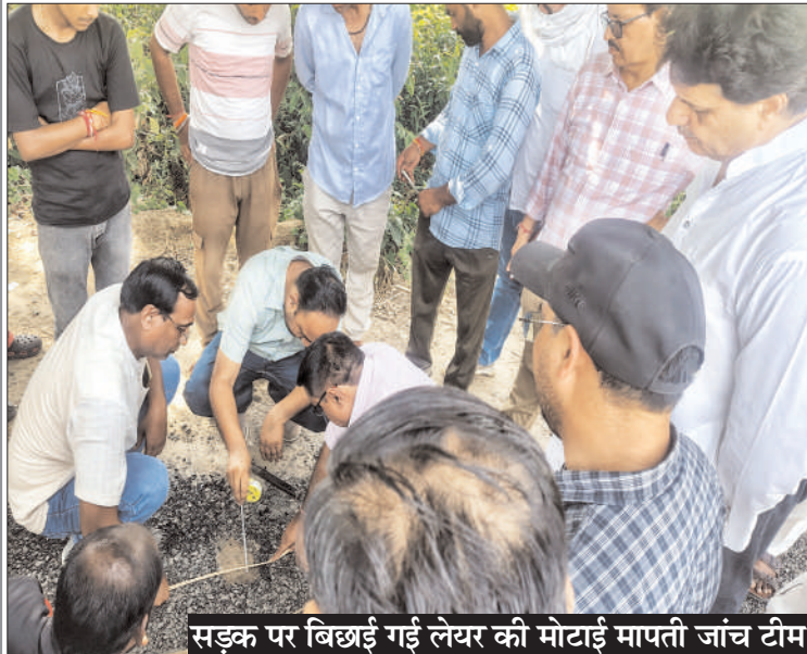
सड़क पर बिछाई गई लेयर की मोटाई मापती जांच टीम

लियर की मोटाई कम पायी गई, नीचे तारकोल भी नहीं डाला