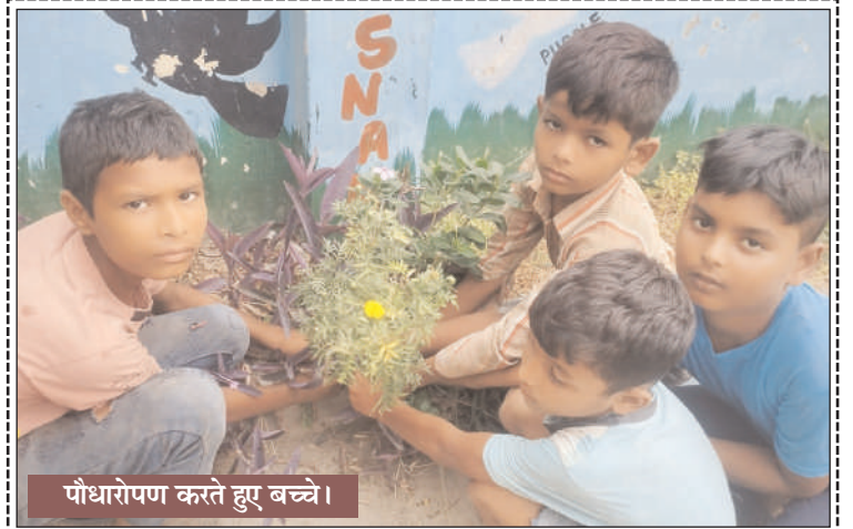
पौधारोपण करते हुए बच्चे।

के समक्ष प्रस्तुत किए जाने से पूर्व व्यापक स्तर पर पुनर्विचार करने का अनुरोध किया है। कहा कि बीडीओ विकास खंड स्तर के वरिष्ठ प्रशासनिक अधिकारी होते हैं जिन्हें शासन की विभिन्न योजनाओं, वित्तीय प्रबंधन और प्रशासनिक प्रक्रियाओं का व्यापक अनुभव होता है। ऐसे में क्षेत्र पंचायत सचिव के रूप में उनकी भूमिका योजनाओं के प्रभावी संचालन और समन्वय के लिए महत्वपूर्ण है।