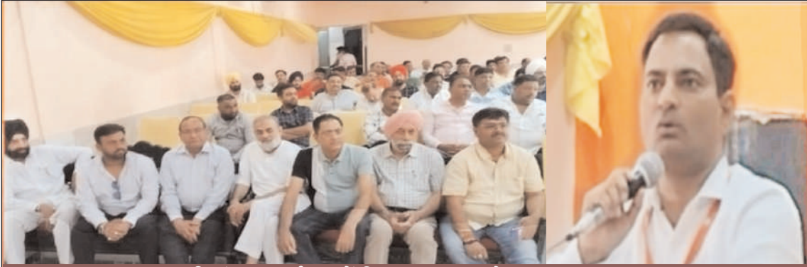
व्यापारी संवाद कार्यक्रम में विचार व्यक्त करते हुए आयुक्त राज्य कर।

व्यापारियों से किया जीएसटी सम्बंधी समस्याओं पर विचार