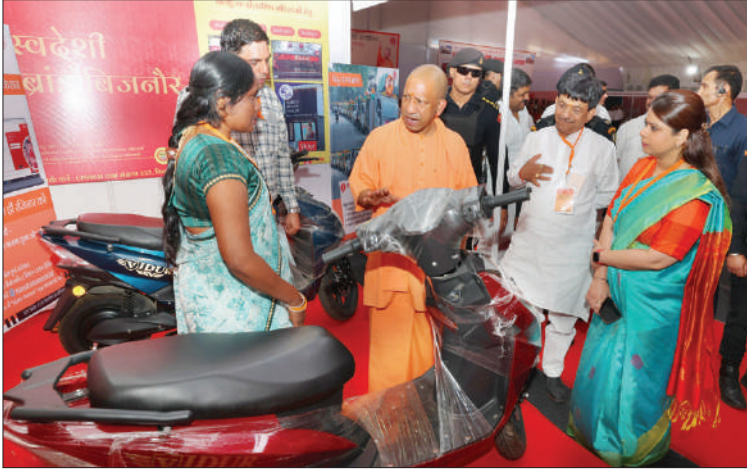
किया गया है। यह मॉडल वोकल फॉर

लोकल, मेक इन इंडिया, आत्मनिर्भर भारत एवं आत्मनिर्भर उत्तर प्रदेश की अवधारणा को धरातल पर साकार कर रहा है।