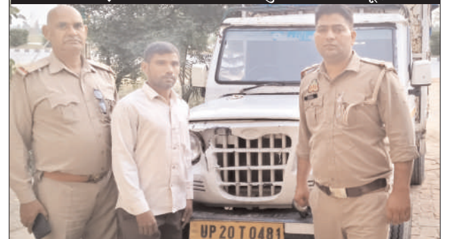
अवैध लकड़ियों से लदे वाहन व अभियुक्त के साथ मौजूद टीम।

कारोबार करने वालों में हड़कंप मच गया है। सूत्रों का कहना है कि शिकायतकर्ता ने ऊपर सिर्फ इसलिए