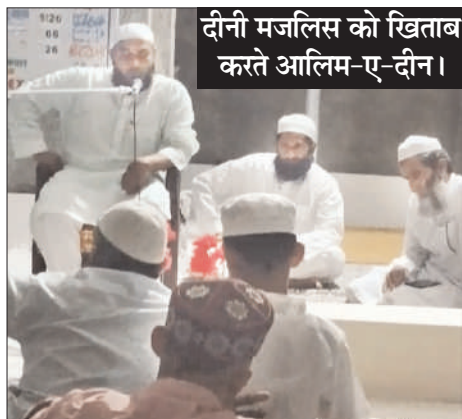
दीनी मजलिस को खिताब करते आलिम-ए-दीन।