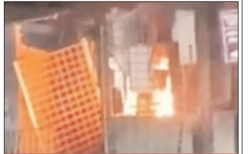
ट्रांसफार्मर की लीड में आग लगने से विद्युतापूर्ति प्रभावित।