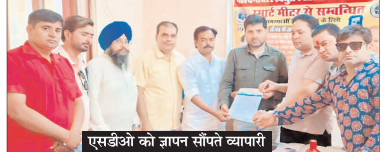
एसडीओ को ज्ञापन सौंपते व्यापारी