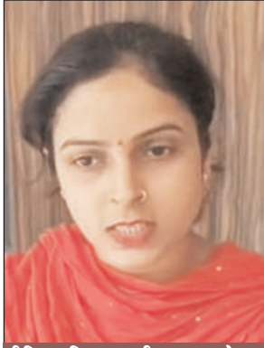
पीड़ित महिला अपनी बात बताते हुए