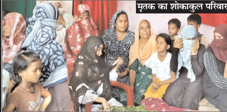
मृतक का शोकाकुल परिवार