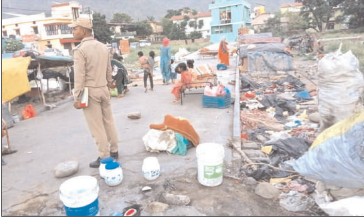
कोटद्वार के काशीरामपुर क्षेत्र में रविवार को प्रशासन की टीम ने अवैध अतिक्रमण हटाया।