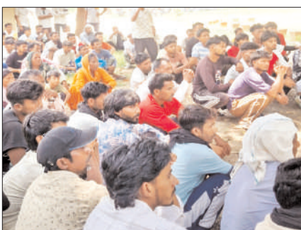
पाखरो गेट खुलवाने की मांग करते ग्रामीण।