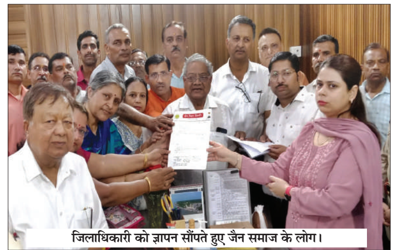
जिलाधिकारी को ज्ञापन सौंपते हुए जैन समाज के लोग।

जैन समाज के विरोध प्रदर्शन सम्बंधी खबरें अन्य पृष्ठों पर भी