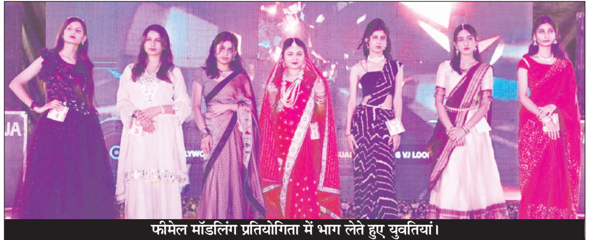
फीमेल मॉडलिंग प्रतियोगिता में भाग लेते हुए युवतियां।