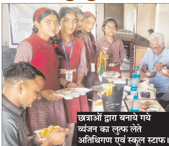
छात्राओं द्वारा बनाये गये व्यंजन का लुत्फ लेते अतिथिगण एवं स्कूल स्टाफ।