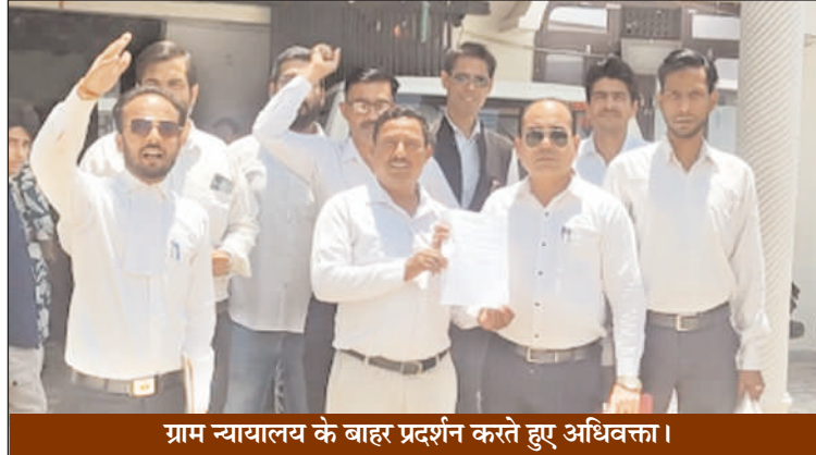
ग्राम न्यायालय के बाहर प्रदर्शन करते हुए अधिवक्ता।

धामपुर (चिंगारी)। सोमवार को अधिवक्ताओं ने दुर्गा विहार कॉलोनी स्थित ग्राम न्यायालय के बाहर प्रदर्शन कर लखनऊ में अधिवक्ताओं के चेंबर पर बुलडोजर चलाए जाने पर रोष व्यक्त किया। उन्होंने कहा कि लखनऊ में अधिवक्ताओं के चेंबर पर बुलडोजर चलाना व अधिवक्ताओं पर लाठी चार्ज किया जाना बेहद दुर्भाग्यपूर्ण है। उन्होंने कहा कि अधिवक्ता समाज का वो अभिन्न अंग है जो आम जन को न्याय दिलवाने का कार्य करता है। ग्राम न्यायालय धामपुर के अधिवक्ताओं ने न्यायालय के बाहर उपस्थित होकर प्रदर्शन किया। सभी अधिवक्ताओं ने न्यायिक कार्य से विरत रहने का निर्णय लिया तथा एक दिवसीय हड़ताल भी की। विरोध प्रदर्शन करने वालों में एड.