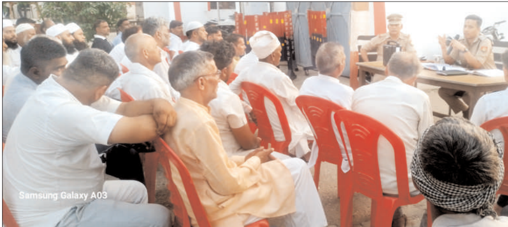
Samsung Galaxy A03