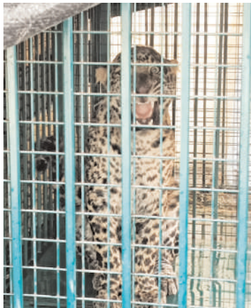
घर के अंदर से रेस्क्यू किया गया गुलदार