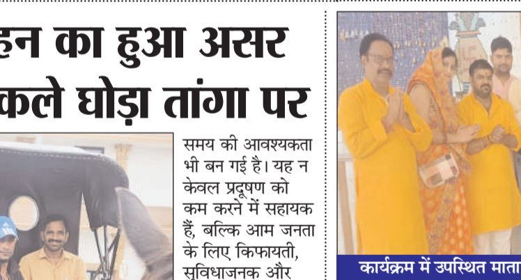
कार्यक्रम में उपस्थित माताएं-बहनें।