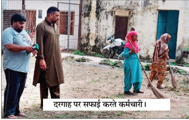
दरगाह पर सफाई करते कर्मचारी।