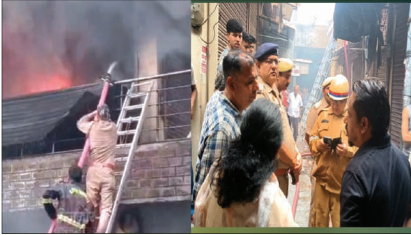
कपड़े की तीन मंजिला बिल्डिंग में लगी आग बुझाती फायर ब्रिगेड की टीम व मौके पर जमा व्यापारियों की भीड़।

फायर ब्रिगेड ने कड़ी मशकत के बाद पांच घंटे में पाया आग पर काबू