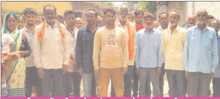
उप जिला अधिकारी कार्यालय के बाहर प्रदर्शन करते हुए ग्रामीण।