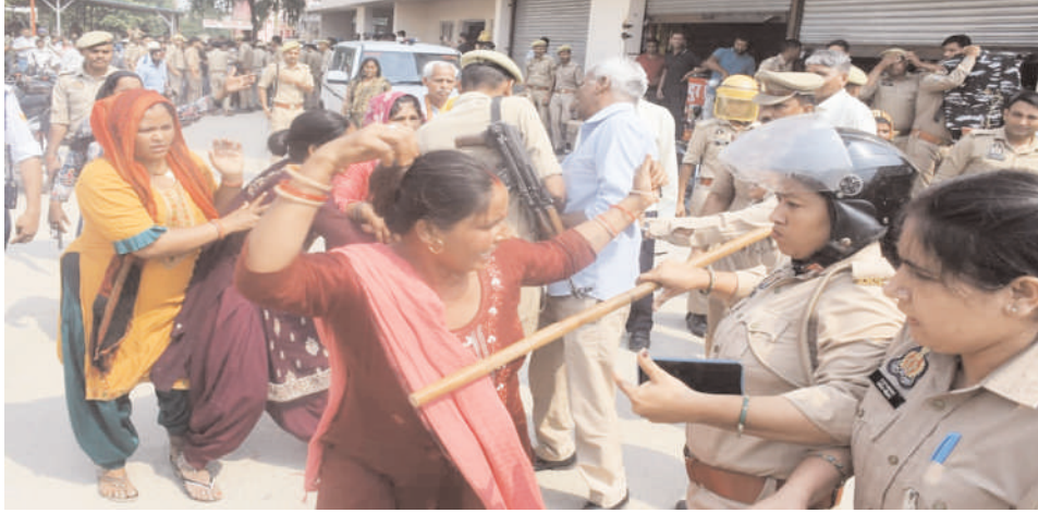
पुलिस के साथ नोकझोंक करते हुए प्रदर्शनकारी महिलाएं।