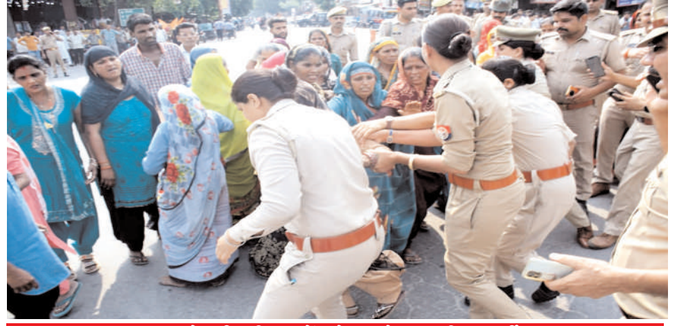
धरना दे रही महिलाओं को हटाते हुए पुलिसकर्मी।