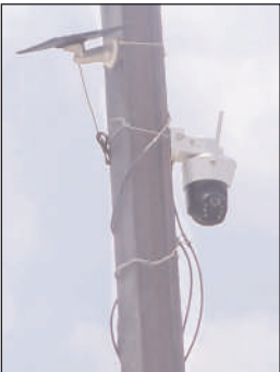
ग्राम खासपुरा के मेन चौक पर लगा हुआ सीसीटीवी कैमरा।