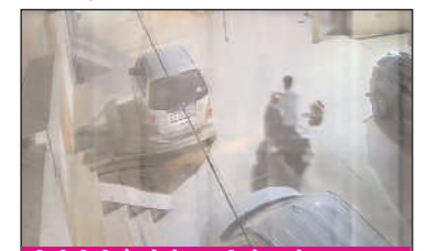
सीसीटीवी कैमरे में स्कूटी ले जाते हुए युवक।