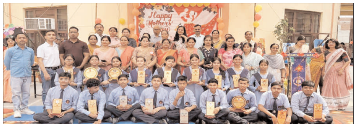
मदस डे पर आयोजित कार्यक्रम में उपस्थित बच्चे और उनकी माताएं।