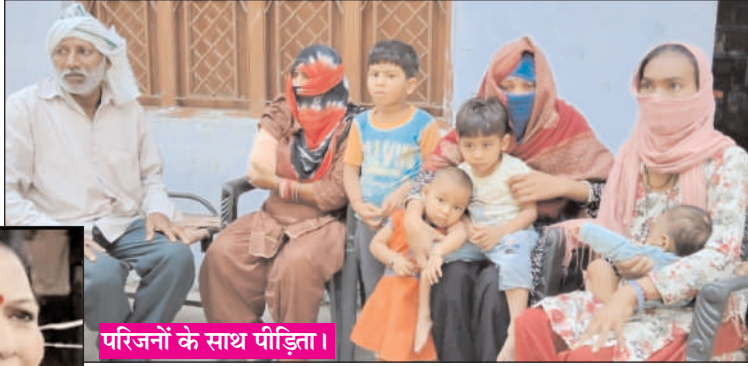
परिजनों के साथ पीड़िता।