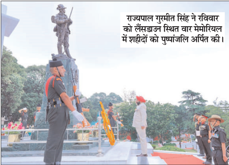
राज्यपाल गुरमीत सिंह ने रिवार को लैंसडाउन स्थित वार मेमोरियल में शहीदों को पुष्पांजलि अर्पित की।

राज्यपाल ने दूसरे दिन के कार्यक्रम की शुरुआत वॉर मेमोरियल पहुंचकर की, जहां उन्होंने राष्ट्र की रक्षा में अपने प्राणों की आहुति देने वाले वीर शहीदों को पुष्पांजलि अर्पित की। इसके उपरांत वे सैनिकों, पूर्व सैनिकों एवं उनके परिजनों के साथ आयोजित सैनिक सम्मेलन में शामिल हुये। सम्मेलन में उन्होंने गढ़वाल राइफल्स केंद्र को उत्कृष्ट योगदान एवं गौरवशाली सैन्य परंपराओं के सम्मान स्वरूप विशेष ट्रॉफी प्रदान की। उन्होंने गढ़वाल राइफल्स की वीरता, अनुशासन एवं