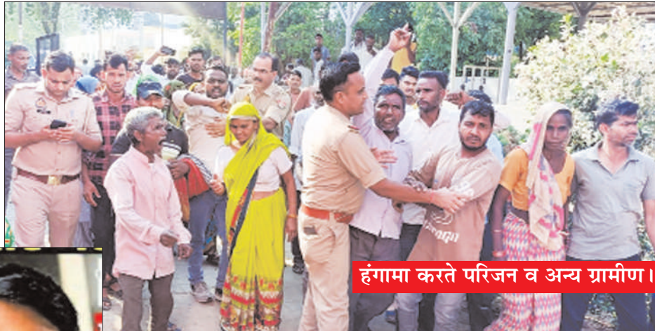
हंगामा करते परिजन व अन्य ग्रामीण।