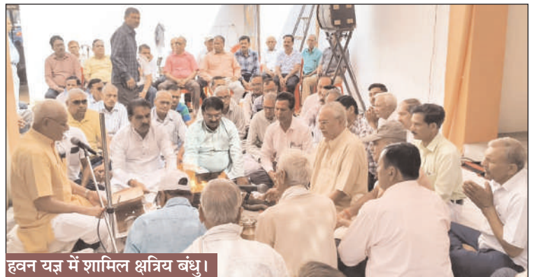
हवन यज्ञ में शामिल क्षत्रिय बंधु।