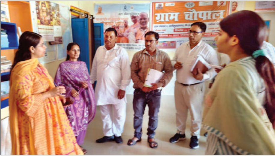
कादराबाद में निरीक्षण करतीं जिलाधिकारी जसजीत कौर।

कासमपुर गढ़ी (चिंगारी)। जिलाधिकारी जसजीत कौर ने शुक्रवार को क्षेत्र के सीमावर्ती कई गांवों का दौरा कर विकास कार्यों का निरीक्षण किया और ग्रामीणों की समस्याएं सुन उनके समाधान हेतु संबंधितों को निर्देशित किया। जिलाधिकारी ने ग्राम तुतपुर में गौशाला, कादराबाद में पंचायत भवन, लाइब्रेरी, निर्माणाधीन उत्सव भवन सरकारी अस्पताल व अन्य सरकारी योजनाओं के क्रियान्वयन का बारीकी से निरीक्षण किया और संबंधित अधिकारियों को आवश्यक दिशा-निर्देश दिये। इस दौरान उन्होंने ग्रामीणों एवं भूतपूर्व सैनिकों की समस्याएं भी सुनीं और उनके हर संभव समाधान का आश्वासन दिया। तत्पश्चात् डीएम जसजीत कौर थाना रेहड़ क्षेत्र के ग्राम छजमलवाला पहुंचीं और वहां भी उन्होंने विकास कार्यों का निरीक्षण करते हुए ग्रामीणों की समस्याएं सुनीं। ग्रामीणों ने जिलाधिकारी को पेयजल, बिजली एवं स्वास्थ्य संबंधी समस्याओं