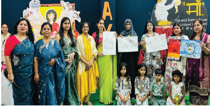
मातृ दिवस पर कार्यक्रम प्रस्तुत करते बच्चे।