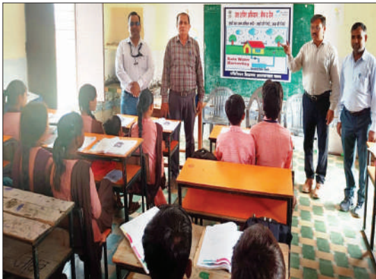
गोष्ठी को सम्बोधित करते बीईओ व शिक्षक।