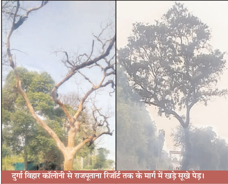
दुर्गा विहार कॉलोनी से राजपूताना रिजॉर्ट तक के मार्ग में खड़े सूखे पेड़।