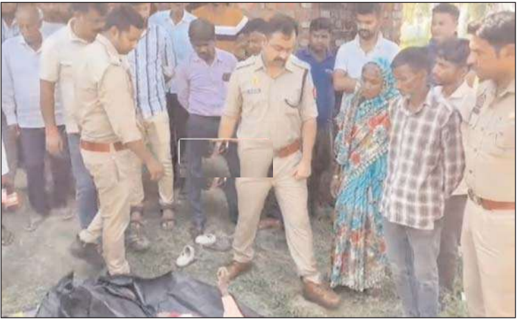
घटनास्थल का निरीक्षण करते हुए पुलिस क्षेत्राधिकारी।