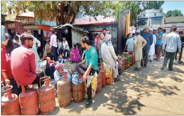
गोदाम पर सिलेंडर लेने के लिए गर्मी व धूप में लम्बी लाइन में लगे उपभोक्ता।

नजीबाबाद (चिंगारी)। नगर के हरिद्वार मार्ग स्थित इण्डेन गैस एजेंसी के गोदाम से भरा हुआ गैस सिलेंडर लेने के लिए उपभोक्ताओं को धूप व गर्मी में लम्बी लाइन में लग कर पसीना बहाना पड़ रहा है। उपभोक्ताओं ने गोदाम पर पच्ची निकालने व कैश जमा करने वाले कर्मचारियों की संख्या बढ़ाने की मांग की है। नजीबाबाद में पिछले कई महीने से पर्याप्त मात्रा में आपूर्ति न आने के कारण इण्डेन गैस की समस्या बनी है। उपभोक्ताओं को इण्डेन गैस का सिलेंडर लेने के लिए काफी मशकत करनी पड़ रही है। नियमानुसार सिलेंडर लेने के 25 दिन बाद गैस बुक कराने के बाद दोबारा गैस लेने के लिए भी करीब 10 से 15 दिन का इंतजार करना पड़ रहा है। काफी परिवार ऐसे हैं जिनका सिलेंडर 25 दिन नहीं बल्कि 20 दिन में ही खत्म हो जाता है। ऐसे परिवारों को सिलेंडर लेने के लिए काफी दिक्कतों का