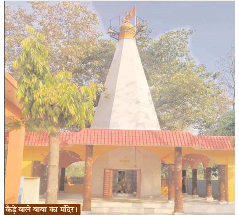
कैड़े वाले बाबा का मंदिर।

किया और क्षेत्र के लोगों को उनके आतंक से मुक्त कराया था। ब्रिटिश गजेटियर में इस युद्ध का वर्णन "Ambitious Jagirdar Fleeing from Other Part Of India" एवं खुट्टैय कला (अलवर) के भाटो ने अपने आलेखों में विस्तार पूर्वक किया है।