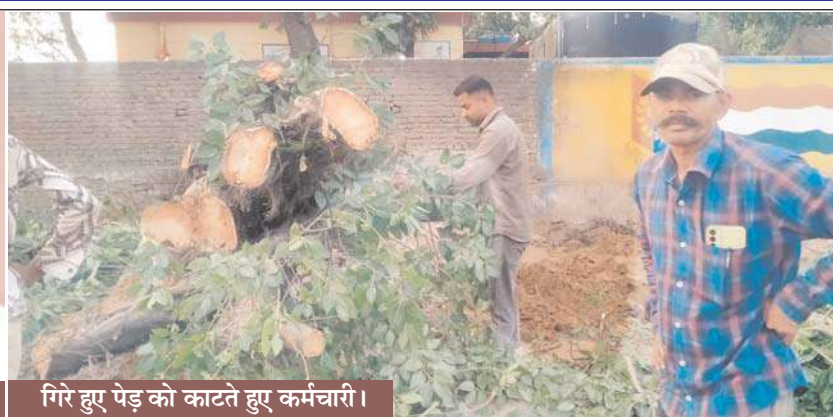
गिरे हुए पेड़ को काटते हुए कर्मचारी।