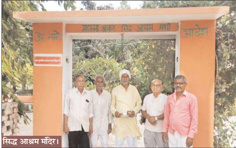
सिद्ध आश्रम मंदिर।