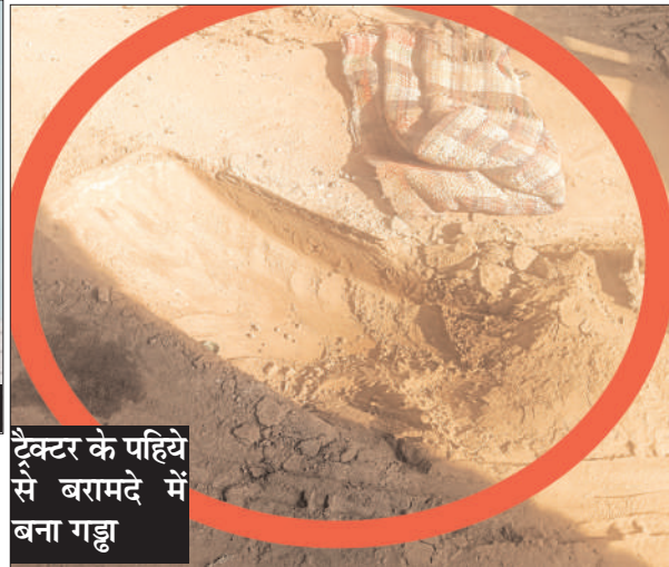
ट्रैक्टर के पहिये से बरामदे में बना गड्ढा