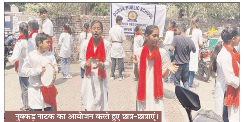
नुक्कड़ नाटक का आयोजन करते हुए छात्र-छात्राएं।