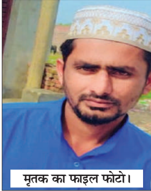
मृतक का फाइल फोटो।

डॉक्टर कमाल मार्केट निकट कमाल नर्सिंग होम मेन मार्केट धामपुर में 9 फुट चौड़ी व 10 फुट लंबी बनी हुई 6 दुकानें बिकाऊ हैं। संपर्क करें- 9412713786