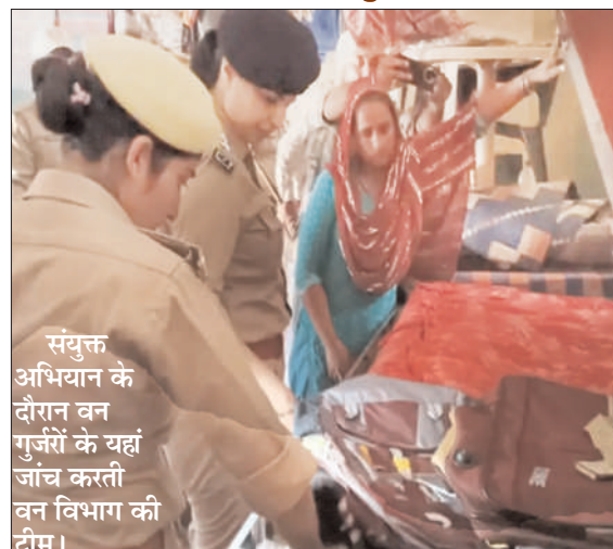
संयुक्त अभियान के दौरान वन गुर्जरों के यहां जांच करती वन विभाग की टीम।