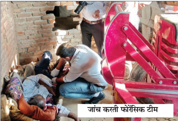
जांच करती फोरेंसिक टीम

नांगल सोती (चिंगारी)। विगत रात्रि ग्राम गौसपुर में चारपाई पर सो रहे व्यक्ति की रहस्यमय ढंग से कुछ दूरी पर खड़े अपने ही ट्रैक्टर के स्टार्ट हो जाने से ट्रैक्टर और दीवार के बीच दबकर मृत्यु हो गई। डीजल होने के बावजूद ट्रैक्टर रहस्यमय तरीके से स्वयं ही बंद भी हो गया। सूचना पर एएसपी (सिटी) तथा सीओ भी मौके पर पहुंचे और घटना की तकनीकी जांच के लिये फोरेंसिक टीम को बुलाया गया।