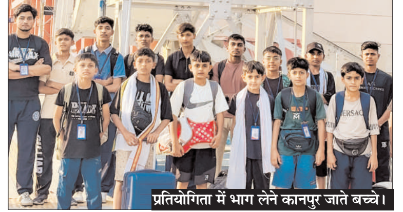
प्रतियोगिता में भाग लेने कानपुर जाते बच्चे।