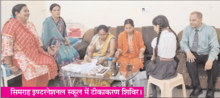
सिमराह इण्टरनेशनल स्कूल में टीकाकरण शिविर।