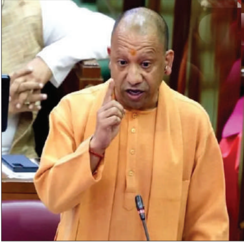
एक-दूसरे को बधाई दी और नारेबाजी की कि हमने महिला आरक्षण विधेयक पारित

लखनऊ (एजेसी/चिंगारी)। मुख्यमंत्री योगी आदित्यनाथ ने गुरुवार को विधानसभा के एक दिवसीय विशेष सत्र में मुख्यमंत्री ने विपक्ष खासतौर पर समाजवादी पार्टी व कांग्रेस पर तीखा हमला किया। उन्होंने नारी सशक्तिकरण पर विस्तृत चर्चा का प्रस्ताव भी रखा। मुख्यमंत्री योगी ने गुरुवार को विधानसभा में कहा कि जब महिलाएं हर क्षेत्र में अपनी प्रतिभा व परिश्रम से लोहा मनवा रही हैं और बेहतरीन नेतृत्व दे रही हैं, तो आप (सपा) लोग क्यों बाधक बन रहे हैं? मुख्यमंत्री ने कटाक्ष किया कि जो लोग काले कर्मों से राजमहल सजाते हैं, वही इतिहास में कलंक बन जाते हैं। योगी ने कहा कि 17 अप्रैल को लोकसभा में नारी शक्ति वंदन अधिनियम का महत्वपूर्ण प्रस्ताव गिराकर समाजवादी पार्टी, कांग्रेस, डीएमके और टीएमसी ने अपने ऊपर कलंक लगाने का काम किया है। सदन में प्रस्ताव गिरते ही