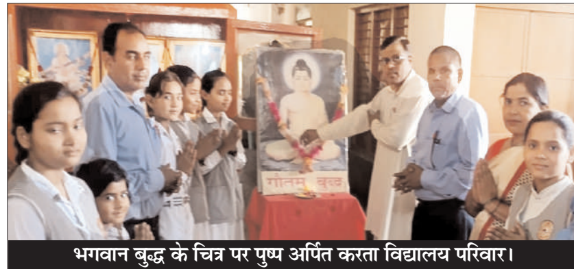
भगवान बुद्ध के चित्र पर पुष्प अर्पित करता विद्यालय परिवार।