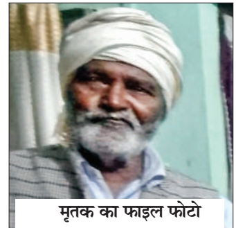
मृतक का फाइल फोटो

पुलिस इस प्रकरण में जांच कर रही है कि ये घटना महज इत्तेफाक है या फिर सुनियोजित तरीके से की गई हलिया। ट्रैक्टर की चाबी अंदर घर में रखी हुई थी। यह जांच का विषय ट्रैक्टर खुद स्टार्ट कैसे हुआ, इसी संदेह के आधार पर पुलिस ने मृतक के परिजनों से काफी देर तक पूछताछ की। घटना