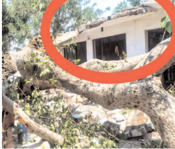
टूटा पड़ा पेड़ तथा क्षतिग्रस्त हुआ छज्जा

नांगल सोती ( चिंगारी )। ग्राम चमरौला के धार्मिक स्थल में खड़ा पीपल का कई सौ वर्ष पुराना विशाल पेड़ आंधी के कारण जड़ से टूटकर गिर गया। इससे चहारदीवारी की दीवारों, भवन का छज्जा तथा नल टूट गया। वहां रह रहे महाराज जी पेड़ की चपेट में आने से बाल-बाल बचे। समीपवर्ती ग्राम चमरौला में गांव के पश्चिमी छोर पर ग्राम देवता स्थित हैं, जिन्हें कोट के देवता का भैया भी कहा जाता है। आषाढ़ के महीने में बड़ी संख्या में क्षेत्रवासी वहां प्रसाद चढ़ाने के लिये जाते हैं। कल शाम आई आंधी से ग्राम देवता स्थल के प्रांगण में खड़ा पीपल