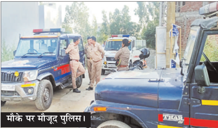
मौके पर मौजूद पुलिस।