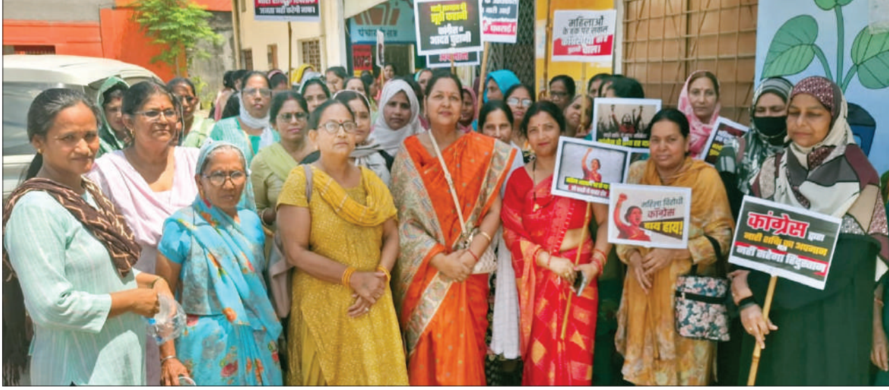
भाजपा की जनाक्रोश रैली में शामिल महिलाएं।

नजीबाबाद (चिंगारी)। नजीबाबाद विधानसभा के गजरौला पाईमार मंडल में नारी शक्ति वंदन अधिनियम लोकसभा में पारित न होने के कारण विपक्ष के खिलाफ महिलाओं द्वारा महिला जनाक्रोश पदयात्रा निकाली गई, जिसमें बड़ी संख्या में महिलाओं व