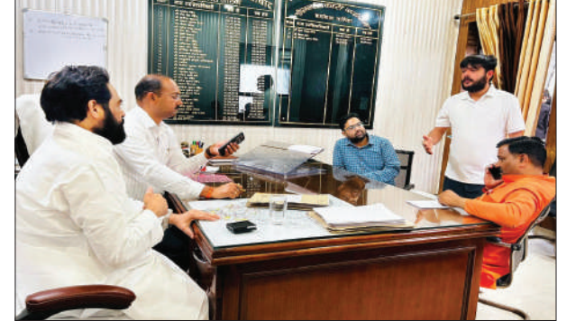
एसडीएम कार्यालय में गैस की समस्या को लेकर वार्ता करते विधायक।