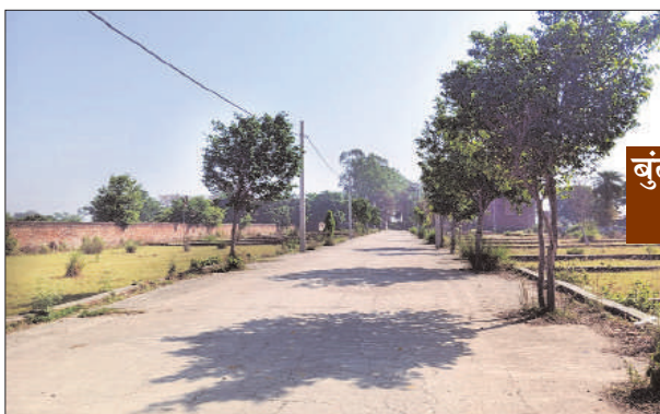
शिकायतकर्ताओं ने मुख्यमंत्री को अवगत कराया कि उनकी कॉलोनी ट्यूबवैल लाइन से जुड़े होने के कारण दिन-रात अघोषित कटौती

कॉलोनी में घर इसलिए खरीदा था ताकि उन्हें बेहतर नागरिक सुविधाएँ मिल सकें। लेकिन वर्तमान में स्थिति यह है कि कॉलोनी की पूरी विद्युत व्यवस्था को पास के गांव की ट्यूबवैल लाइन से जोड़ दिया गया है। उपभोक्ताओं का तर्क है, हमने विकसित कॉलोनी में घर लिया है, किसी खेत या गांव में नहीं। बावजूद इसके उन्हें खेती-किसानी वाली बिजली लाइन पर निर्भर रखा जा रहा है, जहाँ न तो वोल्टेज का कोई ठिकाना है और न ही आपूर्ति के घंटों का। समस्याओं का अंवार: पढ़ाई से लेकर सुरक्षा तक