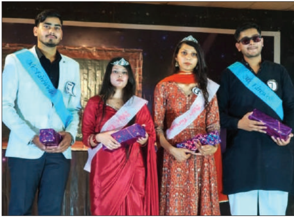
नॉर्थ इंडिया में हुआ फेयरवेल पार्टी का भव्य आयोजन