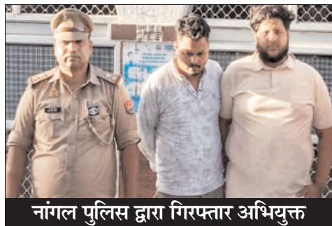
नांगल पुलिस द्वारा गिरफ्तार अभियुक्त