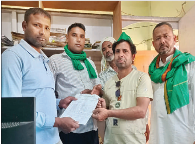
वन विभाग के अधिकारी को ज्ञापन देते विशाल भाकियू के कार्यकर्ता।