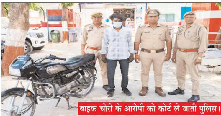
बाइक चोरी के आरोपी को कोर्ट ले जाती पुलिस।