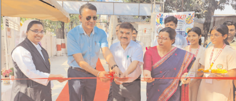
पुष्प निकेतन स्कूल में दो दिवसीय जिला स्तरीय किशोर सम्मेलन अभिव्यक्ति का फीता काटकर शुभारंभ करते हुए अतिथि।

धामपुर (चिंगारी)। धामपुर शहर मिल परिसर स्थित पुष्प निकेतन स्कूल में दो दिवसीय जिला स्तरीय किशोर शिखर सम्मेलन 'अभिव्यक्ति' का आयोजन किया गया। इस युवा महोत्सव में जिले के 13 प्रतिष्ठित विद्यालयों वालिया ग्लोबल एकेडमी, एजुकोल स्कूल, सेंट मेरी, सिमराह इंटरनेशनल, मधुर मेमोरियल, आर.आर. नूरपुर, शिखर शिशु सदन, प्रियंका मॉडर्न धामपुर, भारत स्वरूप एकेडमी, एम.के.डी. अग्रिम, दुर्गा पब्लिक स्कूल, होली एंजेल एकेडमी और आर.आर. मोरारका नजीबाबाद के छात्र-छात्राओं ने उत्साहपूर्वक सहभागिता की। कार्यक्रम में हेल्थ एण्ड वेलनेस प्रदर्शनी, कलाकृति (पेंटिंग), पाठशाला (नुकड़ नाटक), तरंग (भारतीय शास्त्रीय नृत्य) तथा