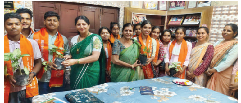
अच्छे अंक लाने वाले विद्यार्थियों को सम्मानित करती प्रबंधक व प्रधानाचार्या।