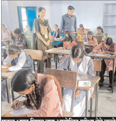
प्रबुद्ध भारत मिशन द्वारा आयोजित परीक्षा देते बच्चे