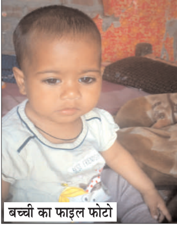
बच्ची का फाइल फोटो