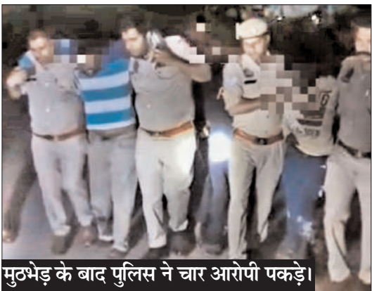
मुठभेड़ के बाद पुलिस ने चार आरोपी पकड़े।