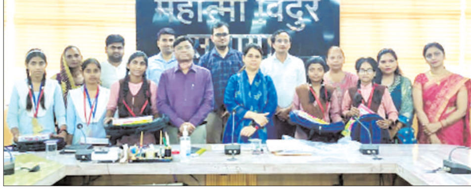
कक्षा 10 में उत्कृष्ट अंक प्राप्त करने वाली छात्राओं को सम्मानित करते हुए डीएम।

उन्होंने निर्देश दिये कि सैम और अन्य कुपोषित बच्चों को शत-प्रतिशत दवाइयों का वितरण तथा पोर्टल पर उनकी फीडिंग का समय से अद्यतन किया जाए। उन्होंने