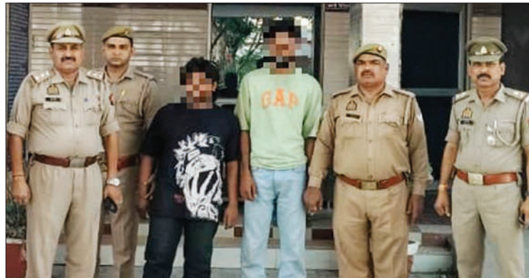
राष्ट्रविरोधी गतिविधियों में गिरफ्तार जीजा-साले