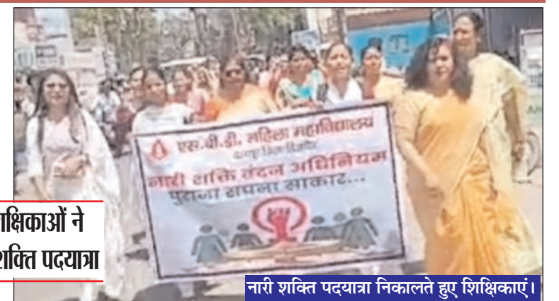
नारी शक्ति पदयात्रा निकालते हुए शिक्षिकाएं।