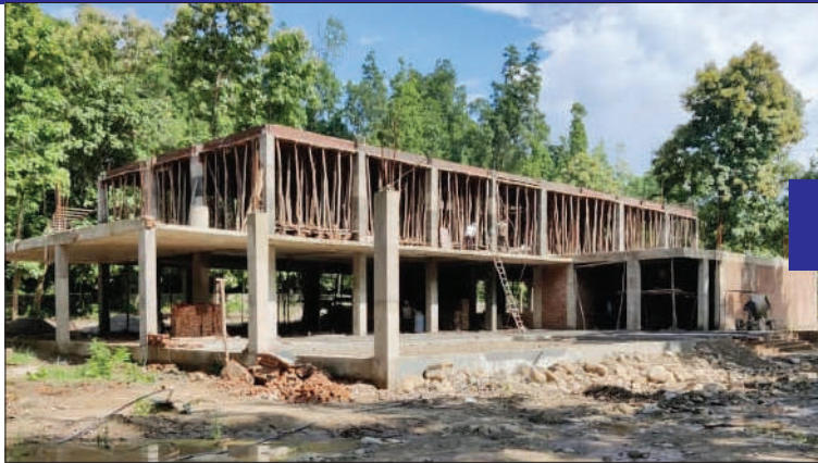
रोजगार बढ़ाना था। वर्ष 2019 में परियोजना के लिए राष्ट्रीय बाघ संरक्षण

जानकारी के अनुसार पाखरो क्षेत्र में टाइगर सफारी विकसित करने की पहल वर्ष 2016-17 के आसपास शुरू हुई थी। इसका उद्देश्य कॉर्बेट के बफर जोन में नियंत्रित पर्यटन विकसित कर कोर एरिया पर दबाव कम करना और स्थानीय स्तर पर