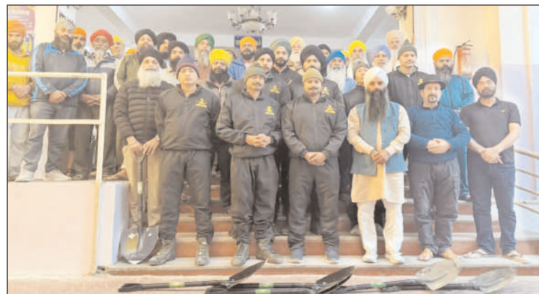
रवाना होने से पूर्व जवान और सेवादार।