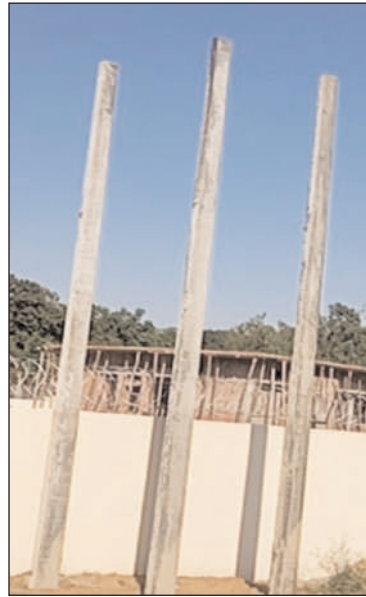
कार्य किया जा रहा है।

गर्मी के दौरान बेहतर विद्युत आपूर्ति प्रदान करने के लिए व ओवरलोड की समस्या का समाधान करने के उद्देश्य से स्योहारा मार्ग पर ग्राम पंचायत मोहडा में कैडे वाले बाबा के मंदिर को जाने वाले मार्ग पर साढ़े छह करोड़ रुपये की लागत से 33/11 के वी विद्युत उपकेंद्र का निर्माण किया जा रहा है जिसका शुभारंभ विद्युत विभाग द्वारा जुलाई 2026 में पूर्ण करने की रणनीति पर