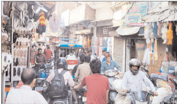
नगीना के मुख्य बाजार में लगे जाम के चलते फंसे वाहन

नगीना में मुंसफ़ी के सामने, गांधी मूर्ति चौक, पुरानी तहसील परिसर के आसपास, बाजार मंडी मौलंगज, लुहारी सराय, पंजाबिया, बाजार गंज,