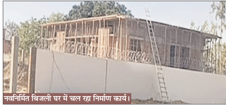
नवनिर्मित बिजली घर में चल रहा निर्माण कार्य।

उपभोक्ताओं को मिलेगी ट्रिपिंग की समस्या से राहत