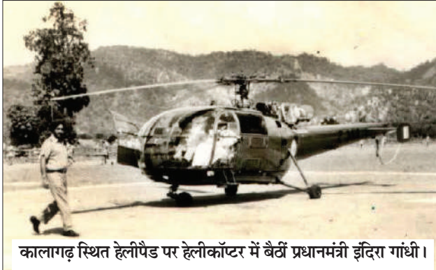
कालागढ़ स्थित हेलीपैड पर हेलीकॉप्टर में बैठीं प्रधानमंत्री इंदिरा गांधी।

रुपये प्रति किलोग्राम थी। लेकिन श्रमिकों के लिए यह राशि उनके परिश्रम का महत्वपूर्ण हिस्सा थी। इसके बावजूद उन्होंने बिना किसी हिचकिचाहट के अपने वेतन का योगदान दिया, जिससे यह सम्मान समारोह ऐतिहासिक बन गया। इंदिरा गांधी के आगमन को लेकर पूरे क्षेत्र में उत्सव जैसा माहौल था। सुरक्षा के कड़े इंतजाम किए गए थे। दूर-दराज के ग्रामों से भी बड़ी संख्या में लोग इस ऐतिहासिक क्षण के साक्षी बनने पहुंचे। इस आयोजन की सबसे उल्लेखनीय बात यह रही कि सम्मान स्वरूप मिली यह चांदी इंदिरा गांधी अपने साथ नहीं ले गईं। उन्होंने तत्कालीन जिलाधिकारी को निर्देश दिये कि इसे जिला कोषागार में सुरक्षित रखवा दिया जाए, तभी से यह 64 किलोग्राम चांदी बिजनौर के कोषागार में डबल लॉक अलमारी में संरक्षित है,