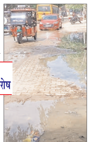
आवागमन में दिक्कत, लोगों में रोष