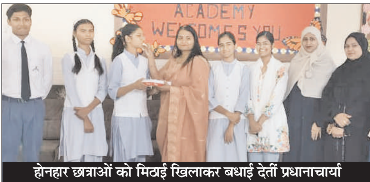
होनहार छात्राओं को मिठाई खिलाकर बधाई देती प्रधानाचार्या