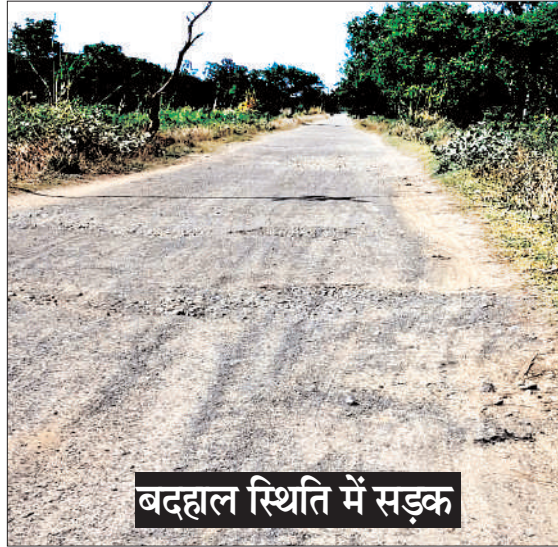
बदहाल स्थिति में सड़क