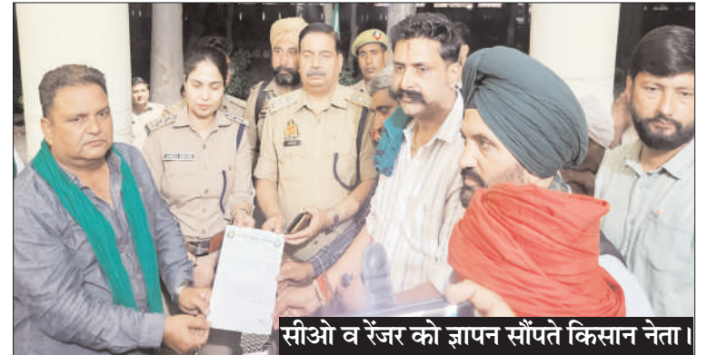
सीओ व रेंजर को ज्ञापन सौंपते किसान नेता।