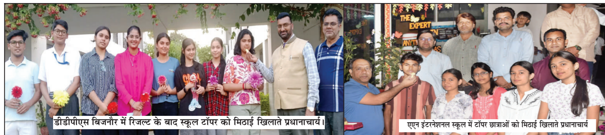
डीडीपीएस बिजनौर में रिजल्ट के बाद स्कूल टॉपर को मिठाई खिलाते प्रधानाचार्य।