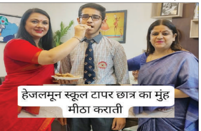
हेजलमून स्कूल टापर छात्र का मुंह मीठा कराती