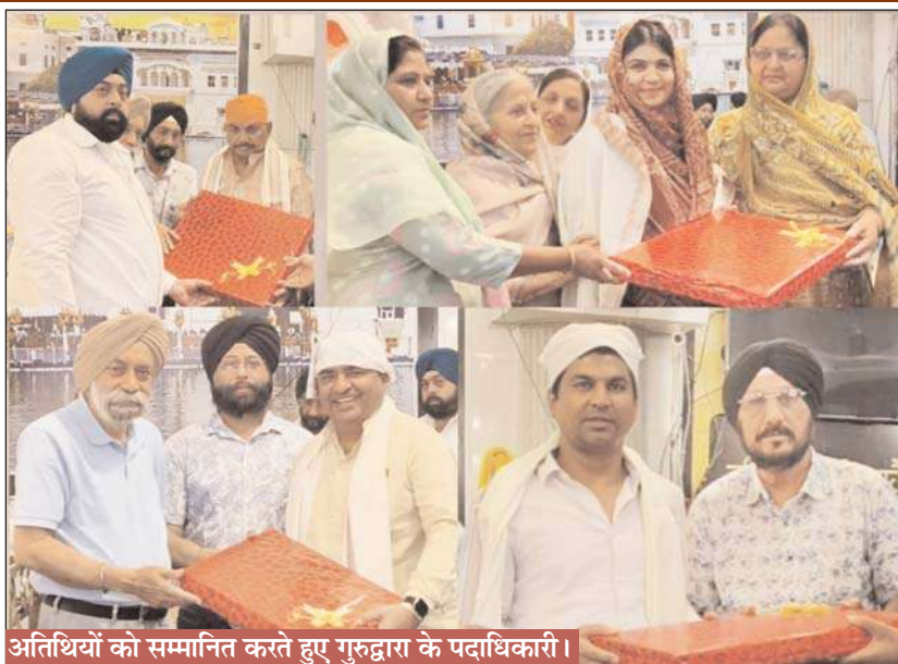
अतिथियों को सम्मानित करते हुए गुरुद्वारा के पदाधिकारी।