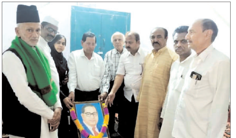
कांग्रेस कार्यालय में श्रद्धांजलि देते कांग्रेस कार्यकर्ता