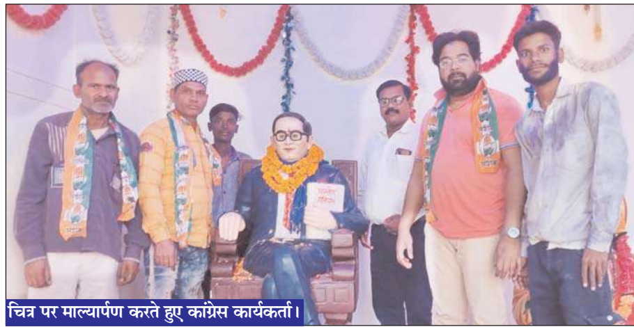
चित्र पर माल्यार्पण करते हुए कांग्रेस कार्यकर्ता।