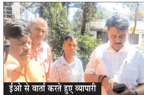
ईओ से वार्ता करते हुए व्यापारी