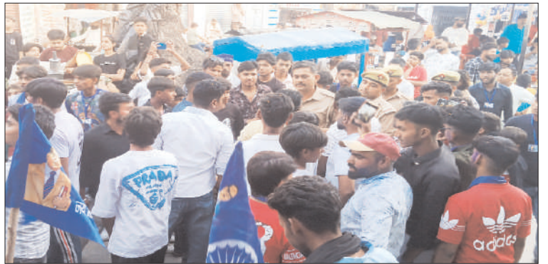
जुलूस में शामिल युवकों एवं पुलिसकर्मियों के बीच होती नोकझोंक।

कासमपुर गढ़ी (चिंगारी)। कासमपुर गढ़ी व सीरवासुचंद में अंबेडकर जयंती की निकाली जा रही शोभायात्रा जैसे ही दोनों गांवों के संयुक्त मुख्य बाजार में पहुंची तो सुरक्षा ड्यूटी में तैनात एक सिपाही द्वारा डीजे की आवाज कम करने को लेकर जुलूस में शामिल कुछ युवक उक्त पुलिसकर्मी से भिड़ गए। उनके बीच काफी देर तक तीखी नोकझोंक हुई, जिसे लेकर श्रद्धालुओं ने जुलूस को वहीं रोक दिया और नारेबाजी करते हुए आवाज कम न करने पर अड़ गए, जबकि जुलूस में ही शामिल कुछ श्रद्धालुओं ने डीजे की ही