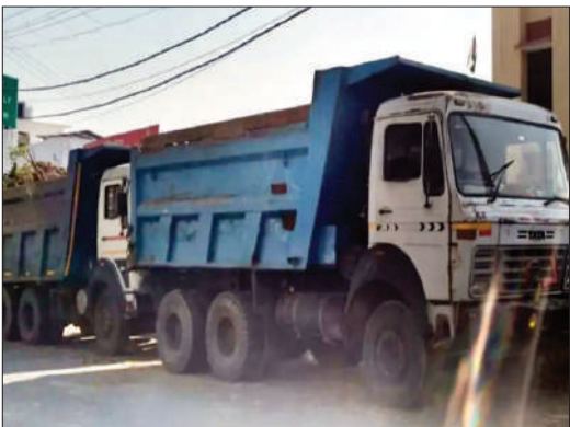
कारण बन सकते हैं। ग्रामीणों और अभिभावकों में इस स्थिति को लेकर गहरी

बताया जा रहा है कि जिस मार्ग से यह अवैध डंपर गुजर रहे हैं, उसी रास्ते पर कई स्कूल और सार्वजनिक स्थल स्थित हैं। जहां दिनभर बच्चों और आम लोगों की भीड़ रहती है। ऐसे में तेज गति से दौड़ते ये भारी डंपर कभी भी बड़े हादसे का