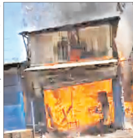
कोटद्वार के मालगोदाम रोड पर स्थित लकड़ी के एक गोदाम में रविवार को आग लग गई।

कोटद्वार (चिंगारी)। कोटद्वार के मालगोदाम रोड पर उस समय अफरा तफरी का माहौल बन गया जब एक लकड़ी के गोदाम में अज्ञात कारणों से आग लग गई। दुकान में आग लगने की सूचना मिलने पर अग्निशमन विभाग की टीम मौके पर पहुंची और कड़ी मशकत के बाद आग पर काबू पाया। प्राप्त जानकारी के अनुसार रविवार को मालगोदाम रोड स्थित एक लकड़ी के गोदाम में अचानक आग लग गई। आग इतनी तेजी से फैली कि देखते ही देखते गोदाम में रखा सामान जलकर खाक हो गया और आसपास की दुकानों भी इसकी चपेट में आ गई। आसपास के लोगों ने धुआं और आग की लपटें देख तत्काल इसकी सूचना दमकल विभाग और पुलिस को दी। सूचना मिलते ही दमकल विभाग की टीम मौके पर पहुंची और आग बुझाने का कार्य शुरू किया। राहत की बात यह रही कि रविवार होने के