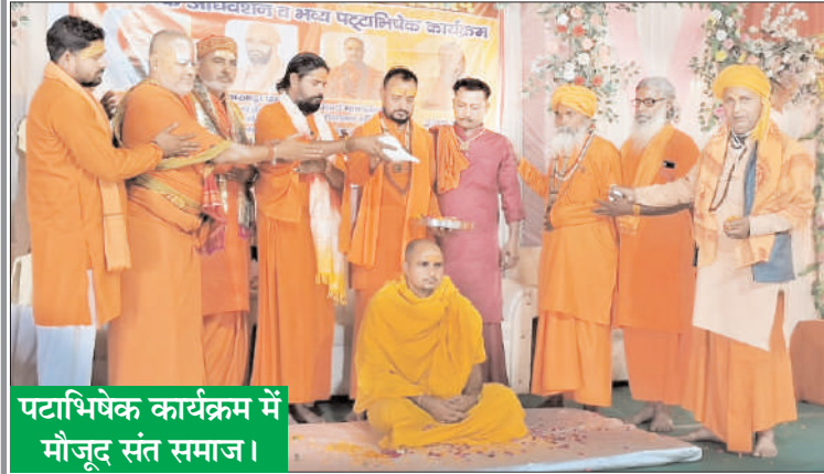
पटाभिषेक कार्यक्रम में मौजूद संत समाज।

नशे और दहेज प्रथा जैसी कुरीति को त्यागने का दिलाया गया संकल्प