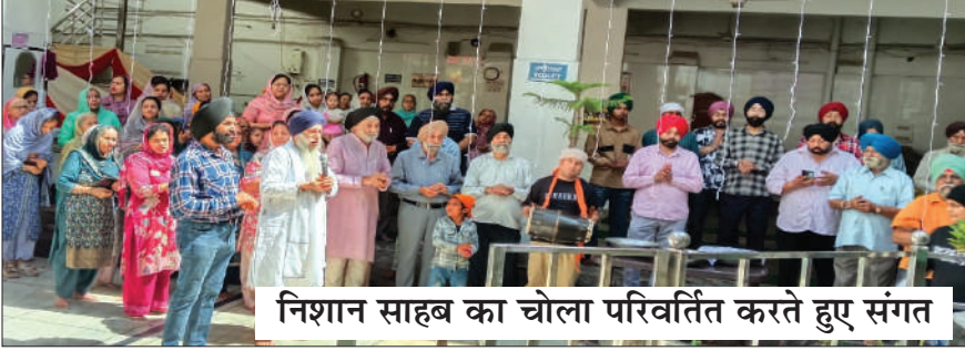
निशान साहब का चोला परिवर्तित करते हुए संगत