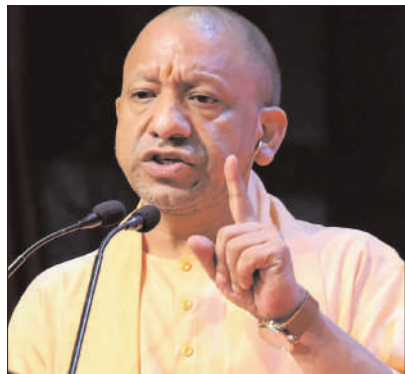
थारू समुदाय, जो महाराणा प्रताप को अपना

लखीमपुर खीरी (एजेंसी/चिंगारी)। उत्तर प्रदेश के मुख्यमंत्री योगी आदित्यनाथ ने शनिवार को बांग्लादेश से विस्थापित विभिन्न हिंदू परिवारों को संक्रमणीय एवं असंक्रमणीय भूमिधरी अधिकार पत्र वितरित करते हुए कहा कि यह केवल प्रशासनिक निर्णय नहीं, बल्कि न्याय का वह क्षण है, जिसने इतिहास की अधूरी तमन्ना को पूरा किया है। उन्होंने कहा कि भारतीय परंपरा में धर्म की व्याख्या परहित सरिस धरम नहिं भाई के रूप में की गई है और इसी भावना के साथ डबल इंजन सरकार पिछले नौ वर्षों से प्रधानमंत्री नरेंद्र मोदी के नेतृत्व एवं मार्गदर्शन में कार्य कर रही है। मुख्यमंत्री ने कहा कि इतिहास में पहली बार