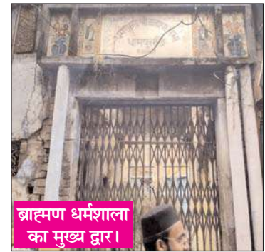
ब्राह्मण धर्मशाला का मुख्य द्वार।

धामपुर ( चिंगारी )। नगर में ब्राह्मण समाज की एकमात्र धर्मशाला आज बदहाली और उपेक्षा का शिकार होकर अपनी दुर्दशा पर आंसू बहाने को मजबूर है। नगर के मोहल्ला बककालन स्थित यह धर्मशाला रखरखाव के अभाव में जर्जर हो चुकी है, जिससे समाज के गरीब और मध्यम वर्गीय परिवारों को अपने धार्मिक अनुष्ठान, विवाह समारोह और अन्य कार्यक्रमों के लिए दूसरे समाज की धर्मशालाओं व मैरिज हॉल का सहारा लेना पड़ रहा है। इस स्थिति के चलते उन्हें भारी आर्थिक बोझ और कई तरह की परेशानियों का सामना करना पड़ रहा है। स्थानीय लोगों का कहना है कि यह धर्मशाला कभी ब्राह्मण समाज की शान और पहचान हुआ करती थी, लेकिन अब इसकी हालत बेहद खराब हो चुकी है। धर्मशाला परिसर में बने फ्रंट की दुकानों पर वर्षों से किरायेदार काबिज हैं, जबकि कुछ दुकानों का नवनिर्माण कर उन्हें गैर समुदाय के लोगों को किराये पर दिए जाने से समाज में रोष व्याप्त है। लोगों का आरोप है कि समाज की इस धरोहर का उपयोग समाजहित में न होकर निजी हितों के लिए किया जा रहा है। सबसे गंभीर बात यह है कि धर्मशाला में मूलभूत सुविधाओं का भी अभाव है। यहां न तो