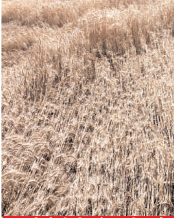
आंधी से गिरी और बारिश से काली पड़ी गेहूं की फसल

ज्ञातव्य है कि 15/16 मार्च की रात्रि में आई जोरदार आंधी से गेहूं की काफी फसल खेतों में बिस्तर की भांति बिछ गई थी। उसके बाद कई बार बारिश भी हुई है। जमीन पर गिरी गेहूं की फसल के ऊपर बरसी बारिश के कारण गेहूं की बाली काली पड़ गई हैं। गिरा हुआ गेहूं दूर से ही काला नजर आ रहा है। इससे किसानों को बड़ा नुकसान हुआ है। एक तो गेहूं का दाना बारीक रह गया है, जिससे गेहूं का उत्पादन 20 से 25 फीसदी घट गया है। दूसरे गेहूं एकदम काला पड़ गया है। काले गेहूं की न कोई डिमांड होती है और न ही उसे सामान्य रेट मिल पाता है। ऐसे गेहूं