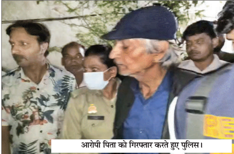
आरोपी पिता को गिरफ्तार करते हुए पुलिस।