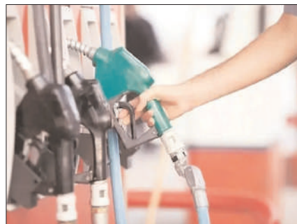
उपलब्धता बनी रहे। खासकर तब जब ग्लोबल स्तर

सरकार ने पेट्रोल-डीजल और जेट फ्यूल को लेकर एक बड़ा फैसला लिया है। शनिवार को डीजल पर एक्सपोर्ट ड्यूटी को दोगुने से अधिक बढ़ाते हुए इसे 21.5 रुपये प्रति लीटर से बढ़ाकर 55.5 रुपये प्रति लीटर कर दिया है, वहीं जेट फ्यूल (ATF) पर एक्सपोर्ट चार्ज को 29.5 रुपये प्रति लीटर से बढ़ाकर 42 रुपये प्रति लीटर कर दिया है। पेट्रोल पर इस चार्ज को पहले की तरह ही