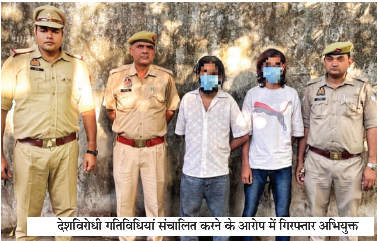
देशविरोधी गतिविधियां संचालित करने के आरोप में गिरफ्तार अभियुक्त

पुनः विवेचना में खतरनाक गैंग का खुलासा हुआ