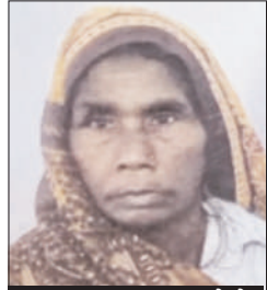
मृतका का फाइल फोटो

शेरकोट ( चिंगारी )। आज सुबह एक बुजुर्ग महिला का शव नेशनल हाइवे से कुछ दूरी पर खेतों की ओर जाने वाले रास्ते में पड़ा मिलने से क्षेत्र में सनसनी फैल गई। मौके पर पहुंची पुलिस ने शव को कब्जे में लेकर पोस्टमार्टम के लिए भेज दिया है।