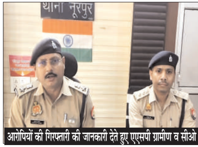
आरोपियों की गिरफ्तारी की जानकारी देते हुए एएसपी ग्रामीण व सीओ