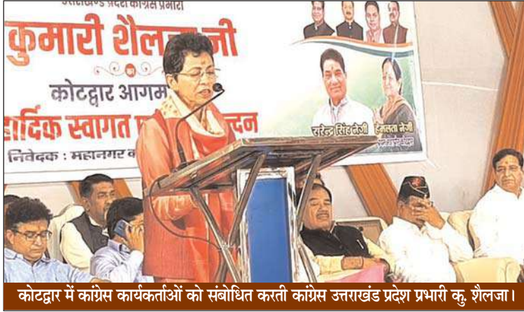
कोटद्वार में कांग्रेस कार्यकर्ताओं को संबोधित करती कांग्रेस उत्तराखण्ड प्रदेश प्रभारी कु. शैलजा।

पांच दिन के उत्तराखण्ड दौरे के अंतर्गत कु. शैलजा कोटद्वार पहुंची। उनके साथ नेता प्रतिपक्ष यशपाल आर्य, पूर्व वन मंत्री डा. हरक सिंह रावत और कांग्रेस प्रदेश अध्यक्ष गणेश गोदियाल भी थे। शुक्रवार को उन्होंने भाबर क्षेत्र के अंतर्गत नौबूचौड़ स्थित एक