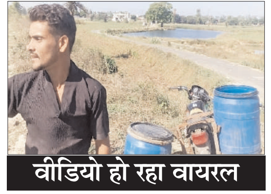
वीडियो हो रहा वायरल

हीमपुर दीपा (चिंगारी)। गंगा से निकलने वाली नहर के पवित्र पानी में गंदगी और मुर्ग के अवशेष डालने संबंधी एक वीडियो वायरल हो रहा है, जिसमें एक युवक यह कुत्सित प्रयास करता साफ नजर आ रहा है। घटना से क्षेत्र के हिंदुवादी संगठनों में भारी आक्रोश है। संगठन के लोगों का कहना है कि इंसान से लेकर जानवर और पशु-पक्षी तक पीने और नहाने के लिये नहर के इसी शुद्ध पानी का इस्तेमाल करते हैं। उन्होंने शासन-प्रशासन से घटना की जांच कर आरोपी के खिलाफ सख्त कार्रवाई कराए जाने की मांग की है। घटनाक्रम सल्लाहपुर गांव के पास नहर का बताया जा रहा है। चिंगारी वीडियो की पुष्टि नहीं करता है।