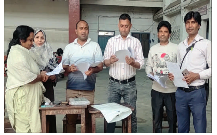
बूथ पर मतदाता सूची देखते बीएलओ।