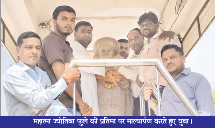
महात्मा ज्योतिबा फुले की प्रतिमा पर माल्यार्पण करते हुए युवा।