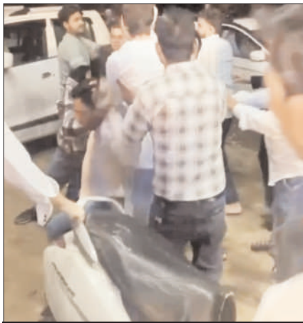
हंगामे का दृश्य।

जानकारी के अनुसार मोहल्ला इस्लाम नगर के एक युवक की बारात नहटौर के धामपुर मार्ग पर एक बैंक हॉल में आई थी। वधू पक्ष मूल रूप से नहटौर के एक गांव का है। जब निकाह की रस्में शुरू होने वाली थीं, तभी अचानक दुल्हन ने निकाह करने से मना कर दिया। दुल्हन के इस फैसले से मौके पर सन्नाटा पसर गया और