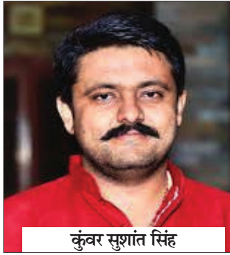
कुंवर सुशांत सिंह

बिजनौर (चिंगारी)। उत्तर प्रदेश सरकार की कैबिनेट द्वारा लिए गए महत्वपूर्ण निर्णय के तहत बढ़ापुर विधानसभा क्षेत्र में भारत-पाक विभाजन के समय विस्थापित होकर आए हजारों शरणार्थी परिवारों को उनकी भूमि पर स्वामित्व अधिकार प्रदान किए जाने का रास्ता साफ हो गया है। इस ऐतिहासिक फैसले पर बढ़ापुर से भाजपा विधायक कुंवर सुशांत सिंह ने क्षेत्रवासियों को बधाई दी। उन्होंने बताया कि इस जनहितकारी निर्णय से भूतपूर्व सैनिकों को पूर्व में आवंटित भूमि का श्रेणी परिवर्तन भी संभव होगा। साथ ही नगीना तहसील के 17 गांवों में लंबे समय से चल रहे जंगल-झाड़ी संबंधी विवादों का भी निस्तारण किया जाएगा।