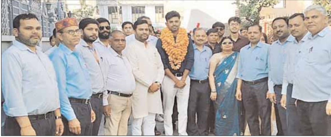
विद्यालय में अध्ययन रत छात्रों को प्रतियोगिता परिक्षाओं में सफलता हेतु