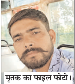
मृतक का फाइल फोटो।

अनुबंधित बस में गमछे से लगाई फांसी, पारिवारिक कलह की आशंका, चार बच्चों के सिर से उठा पिता का साया