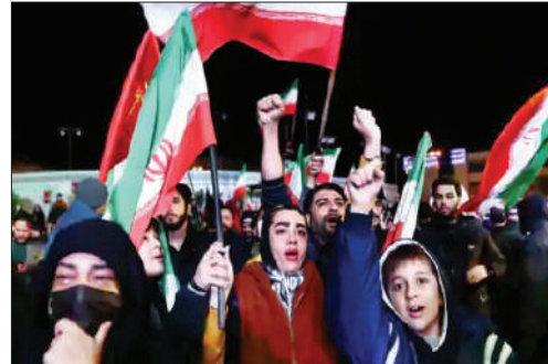
सीजफायर होने के बाद ईरान में जश्न मनाते लोग।

उसकी पूरी सभ्यता खत्म कर देंगे। उन्होंने अहम इंफ्रास्ट्रक्चर पर हमले की भी धमकी दी थी। न्यूयॉर्क टाइम्स की रिपोर्ट के मुताबिक यह डील पाकिस्तान की मध्यस्थता और आखिरी समय में चीन के दखल के बाद संभव हो पाई। पाकिस्तान ने 2 हफ्ते के सीजफायर का प्रस्ताव रखा था, जिसे ईरान ने स्वीकार कर लिया। समझौते के तहत अमेरिका और इजराइल अपने हमले रोकेंगे। ईरान भी हमले बंद करेगा। इस दौरान होर्मुज स्ट्रेट से तेल, गैस और अन्य जहाजों की सुरक्षित आवाजाही ईरानी सेना की मदद से सुनिश्चित की जाएगी। यह सीजफायर लेबनान समेत अन्य क्षेत्रों पर भी लागू होगा। इसके बाद अमेरिका और ईरान के बीच 10 अप्रैल को औपचारिक बातचीत पाकिस्तान की राजधानी इस्लामाबाद में शुरू होगी। ट्रम्प ने बताया कि ईरान ने अमेरिका को 10 पाइंट का प्लान भेजा है। उन्होंने कहा