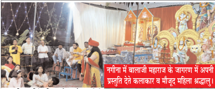
नगीना में बालाजी महाराज के जागरण में अपनी प्रस्तुति देते कलाकार व मौजूद महिला श्रद्धालु।

नगीना ( चिंगारी )। श्रीराम सेवा समिति द्वारा आयोजित बालाजी महाराज के भव्य जागरण में बाहर से आए कलाकारों द्वारा रात भर बालाजी के भजनों का गुणगान किया गया। जागरण में सैकड़ों की संख्या में महिला-पुरुष श्रद्धालु स्वामीनी व छप्पन भोग का प्रसाद चढ़ाकर पूरी रात भजनों पर झूमते रहे।