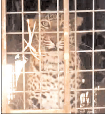
है। मृत्यु के कारणों की जानकारी पोस्टमार्टम के बाद ही हो पाएगी। इसके