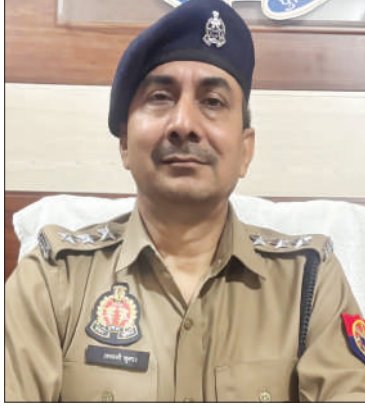
लगातार काम के प्रति सजक रहने की उनकी इस कला ने उन्हें लोगों के बीच खास लोकप्रिय बनाने

कुशलता के बल पर उस मसले को हल करते हुए अपना लोहा मनवाने का काम किया। उन्हें लोग हर कठिन मसले पर 'संकट मोचन' होने का नाम भी देने लगे थे।