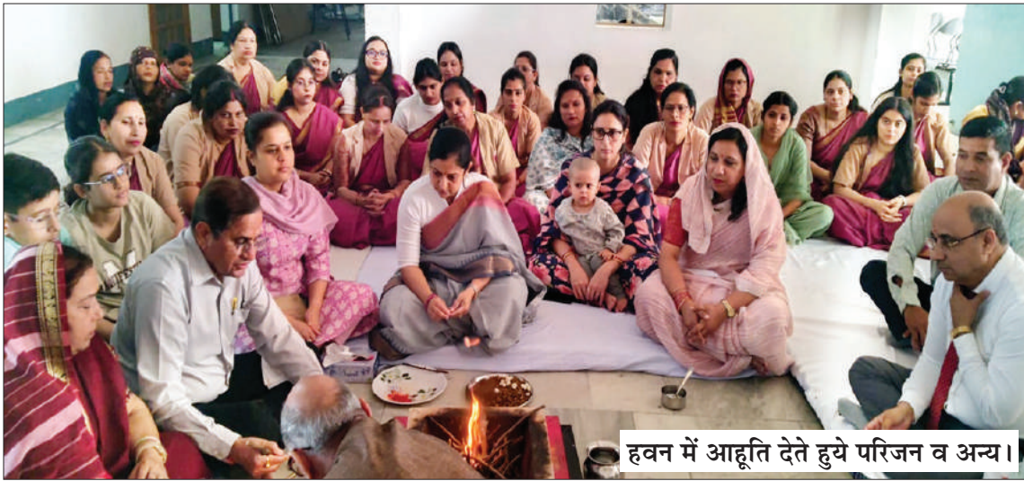
हवन में आहूति देते हुये परिजन व अन्य।