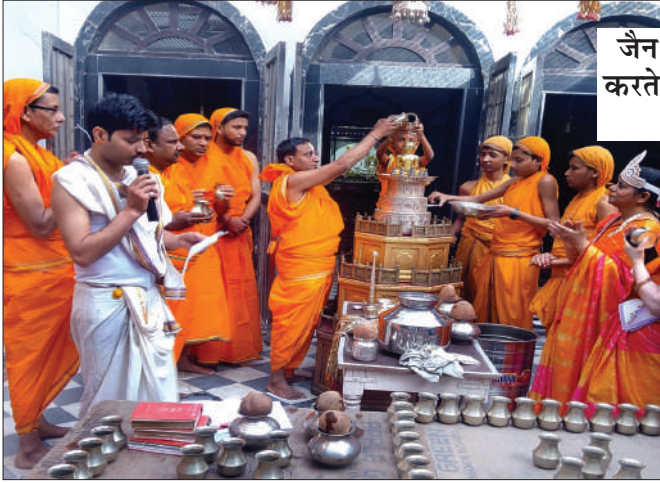
कराया गया। जिसमें समाज के लोगों ने उत्साह से

नजीबाबाद (चिंगारी)। श्री दिगंबर जैन पंचायती मन्दिर नजीबाबाद में 24 वें तीर्थंकर श्री महावीर भगवान का जन्म कल्याणक उत्साह, उमंग व हर्षोल्लास के साथ मनाया गया। सर्वप्रथम प्रभात फेरी निकाली गई। प्रभात फेरी के आगे जैन समाज श्राविकाओं ने धार्मिक भजन गाकर माहौल भक्तिमय बनाए रखा। प्रभात फेरी जियो और जीने के संदेश के साथ मंदिर पहुंची। मार्ग पर काफी श्रद्धालुओं ने अपने घर के सामने पालकी की आरती कर पुण्य लाभ अर्जित किया। सरजायती दिगम्बर जैन मन्दिर व पंचायती मन्दिर पर ध्वज स्थापित किया गया। समाज से 108 कलशों से विशेष नमन