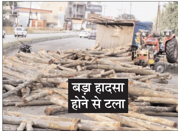
बड़ा हादसा होने से टला

शेरकोट ( चिंगारी )। नेशनल हाइवे पर लकड़ी से भरी ट्रैक्टर-ट्राली पलटने से बड़ा हादसा होने से बच गया। इस घटना में ट्राली में भरी लकड़ी पूरी सड़क पर बिखर जाने से हाइवे की एक लेन बंद हो गई। जानकारी के अनुसार बुधवार की शाम छः बजे