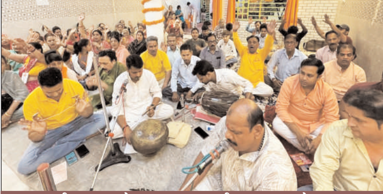
श्री हनुमान जन्मोत्सव पर हनुमान चालीसा का पाठ करते हुए।