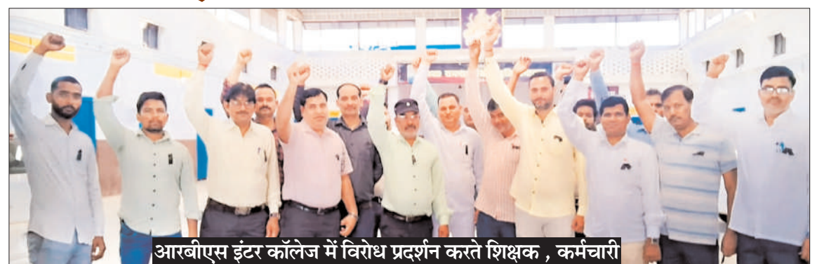
आरबीएस इंटर कॉलेज में विरोध प्रदर्शन करते शिक्षक, कर्मचारी

नांगल सोती ( चिंगारी )। स्थानीय राजा भरत सिंह इंटर कॉलेज के शिक्षकों, शिक्षणोत्तर कर्मचारियों ने केन्द्र सरकार द्वारा लागू की गई राष्ट्रीय पेंशन योजना (एनपीएस), एकीकृत पेंशन योजना (यूपीएस) के विरोध में काली पट्टी बांधकर विरोध प्रदर्शन किया। शिक्षकों, शिक्षणोत्तर कर्मचारियों ने कहा कि एक अप्रैल, 2005 को सरकार ने पुरानी पेंशन