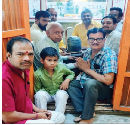
मंदिर में पूजा-अर्चना करते श्रद्धालु।