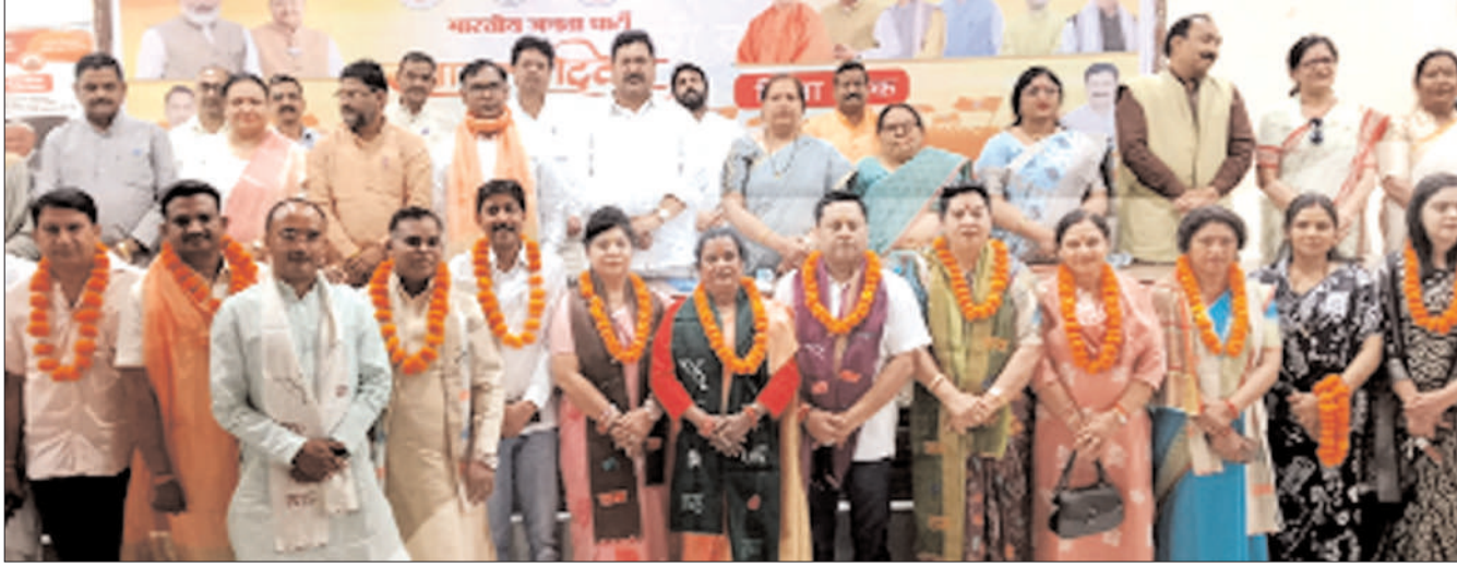
भारतीय जनता पार्टी बिजनौर की जिला कार्यकारिणी के पदाधिकारी को सम्मानित करते हुए वरिष्ठ नेता।

बिजनौर ( चिंगारी )। भारतीय जनता पार्टी (भाजपा) के स्थापना दिवस के उपलक्ष्य में जिला कार्यालय पर एक महत्वपूर्ण बैठक का आयोजन किया गया। बैठक का उद्देश्य संगठन को मजबूत करना, नवनिर्वाचित जिला कार्यकारिणी का स्वागत और आगामी रणनीतियों पर चर्चा करना रहा। कार्यक्रम में क्षेत्रीय महामंत्री एवं जिला प्रभारी हरिओम शर्मा मुख्य अतिथि के रूप में उपस्थित रहे। उन्होंने कार्यकर्ताओं को संबोधित करते हुए पार्टी की विचारधारा