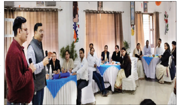
कार्यशाला में मौजूद छात्र व शिक्षक।