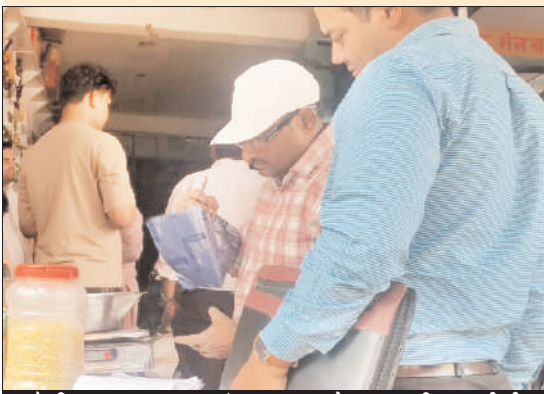
नहटौर स्थित एक दुकान पर जांच पड़ताल करते हुए खाद्य विभाग की टीम।