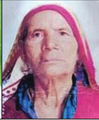
मृतकों के फाइल फोटो।