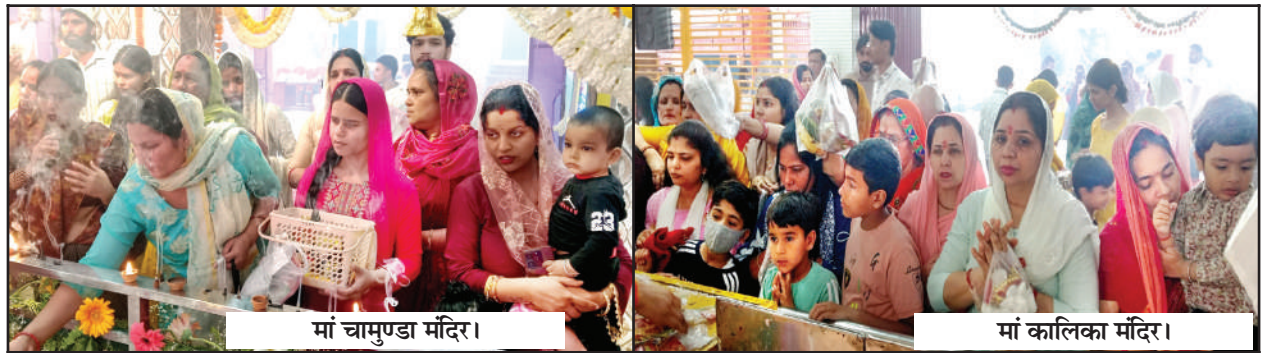
मां चामुण्डा मंदिर।