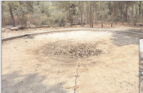
खराब होने की वजह से सूखा पड़ा वाटर होल।

अफजलगढ़ (चिंगारी)। उत्तर प्रदेश के प्रमुख वन्यजीव पर्यटन स्थलों में शामिल अमानगढ़ टाइगर रिजर्व इन दिनों पर्यटकों की बढ़ती संख्या के बावजूद मूलभूत सुविधाओं के अभाव से जूझ रहा है। विशेष रूप से वन क्षेत्र के भीतर झिरना गेट के समीप स्थित कैटीन के बंद होने से पर्यटकों को भारी असुविधा का सामना करना पड़ रहा है।