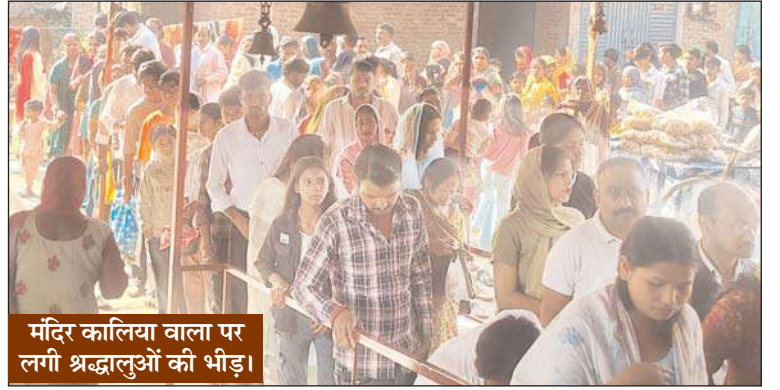
मंदिर कालिया वाला पर लगी श्रद्धालुओं की भीड़।

धामपुर (चिंगारी)। नगीना मार्ग स्थित प्राचीन सिद्ध पीठ मंदिर कालिया वाला पर आज चैत्र नवरात्रि की सप्तमी पर विशाल मेला आयोजित किया गया। जिसमें आसपास के ग्रामों से भी बड़ी संख्या में पहुंचे श्रद्धालुओं ने भाग लिया। इस दौरान मेले में सजी दुकानों पर जहां माता रानी के भक्तों ने पूजा अर्चना से संबंधित सामग्री की खरीदारी की वहीं चाट, पकौड़ी, सौंदर्य प्रसाधन आदि दुकानों पर भी पुरुषों, महिलाओं और बच्चों द्वारा जमकर खरीदारी होती देखी गई। प्रातः 5 बजे से ही श्रद्धालु परिवारों ने प्राचीन सिद्ध पीठ मंदिर कालिया वाला और माता बाराही शक्ति पीठ पर पहुंचना प्रारंभ कर दिया था। इस दौरान श्रद्धालुओं ने जहां पूजा अर्चना करते हुए माता रानी को नारियल एवं चुनरी भेंट की वहीं श्रृंगार की वस्तु अर्पित करते हुए माता रानी से सुख समृद्धि का आशीर्वाद बनाए रखने की कामना की। इस अवसर पर मंदिर परिसर माता रानी के पारंपरिक भजनों एवं जयकारों से गुंजायमान रहा।