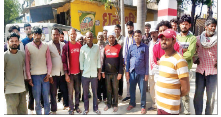
पोस्टमार्टम हाउस पर इकट्ठा हुए ग्रामीण।