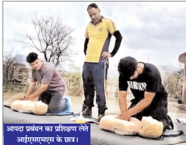
आपदा प्रबंधन का प्रशिक्षण लेते आईएसएमएस के छात्र।

इस योजना का उद्देश्य युवाओं को आपदाओं के समय प्रथम प्रतिक्रिया देने वाले के रूप में तैयार करना है, ताकि वे बाढ़, भूकंप, भूस्खलन एवं अन्य आपदा स्थितियों में