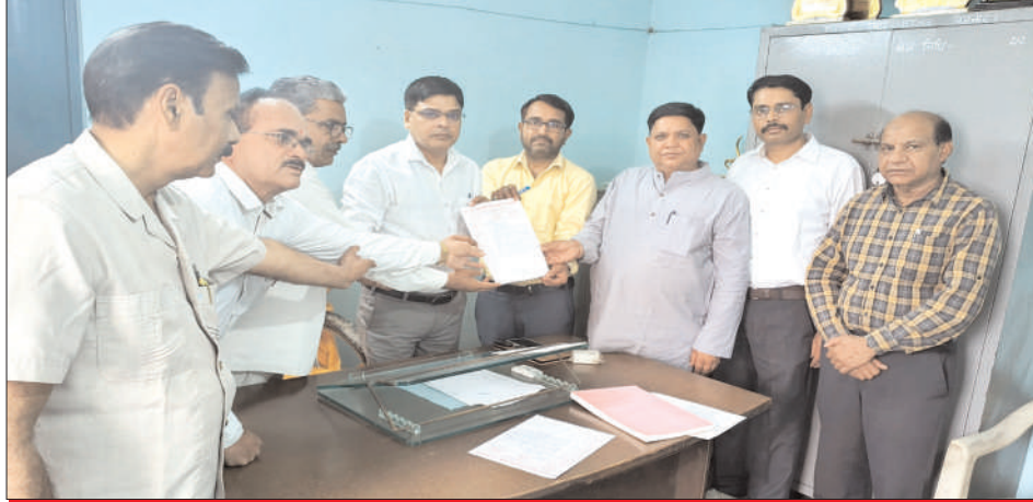
सह जिला विद्यालय निरीक्षक को ज्ञापन देते प्रधानाचार्य परिषद के पदाधिकारी

गौरतलब है कि 18 मार्च से प्रदेश में यूपी बोर्ड परीक्षा 2026 की हाईस्कूल व इंटरमीडिएट परीक्षाओं की उत्तर पुस्तिकाओं का मूल्यांकन कार्य चल रहा है। इस बार बोर्ड द्वारा मूल्यांकन कार्य में प्रधानाचार्यों को परीक्षकों द्वारा जांचों गई उत्तर पुस्तिकाओं के अंकेक्षक कार्य में नियुक्त किया गया है। अंकेक्षक कार्य में प्रधानाचार्यों को नियुक्त