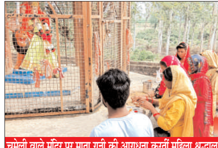
चमेली वाले मंदिर पर माता रानी की आराधना करती महिला श्रद्धालु

माता रानी की आराधना करने वालों पर उनकी ऐसी कृपा होती है कि भक्तों के सभी दुख-संकट, कष्ट मिट जाते हैं। मां शैलपुत्री नवदुर्गाओं में प्रथम दुर्गा हैं। पर्वतराज हिमालय के घर पुत्री रूप में जन्म लेने के