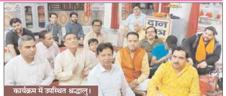
कार्यक्रम में उपस्थित श्रद्धालु।