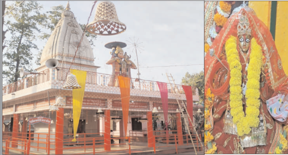
चांदपुर ( चिंगारी )। नगर में बिजनौर बाईपास रोड स्थित महाभारत कालीन मां काली का मंदिर

लाखों श्रद्धालुओं की आस्था का केन्द्र है। मंदिर परिसर में खड़ा विशाल वट वृक्ष मंदिर की प्राचीनता