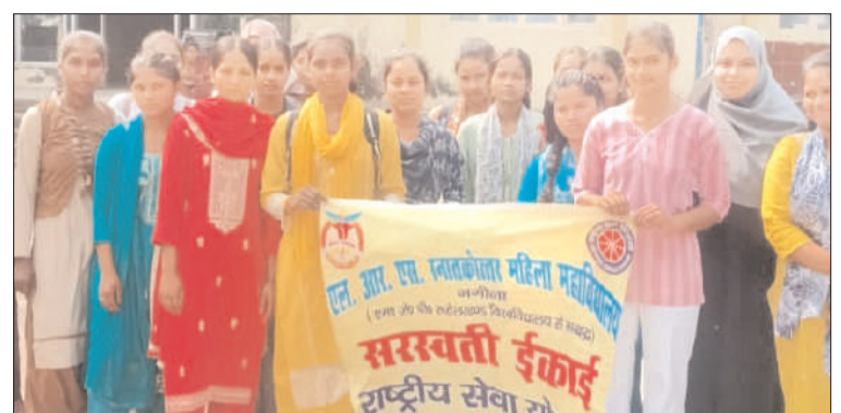
जागरूकता रैली निकलती राष्ट्रीय सेवा योजना इकाई की छात्राएं।