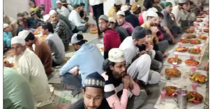
आजाद नगर स्थित मस्जिद में सामूहिक रोजा इफ्तार करते लोग।