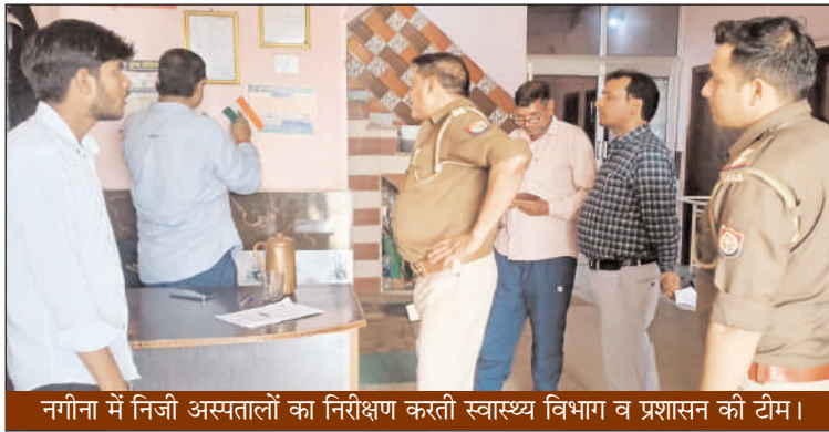
नगीना में निजी अस्पतालों का निरीक्षण करती स्वास्थ्य विभाग व प्रशासन की टीम।