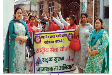
सड़क सुरक्षा को लेकर जागरूकता रैली निकालती छात्राएं।