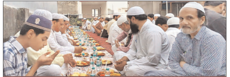
रोज़ा इफ्तार में शामिल रोज़ेदारों ने देश में अमन-शांति और खुशहाली के लिए दुआएं की।