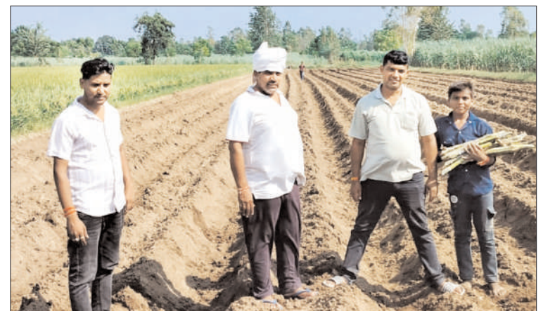
ग्राम चंदोक में गन्ने की बुआई में जुटे किसान।

नांगल सोती (चिंगारी)। गन्ने की बुआई इस समय जोरों पर चल रही है, मगर किसान बुआई के लिये बीज (प्रजाति) के चयन को लेकर काफी असमंजस में नजर आ रहे हैं। गन्ना विभाग तथा चीनी मिल के काफी मना करने के बावजूद कुछ किसान रेड रॉट से ग्रसित गन्ना प्रजाति सीओ-0238 की बुआई भी कर रहे हैं।