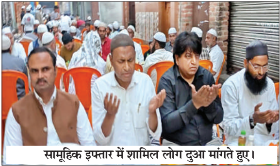
सामूहिक इफ्तार में शामिल लोग दुआ मांगते हुए।